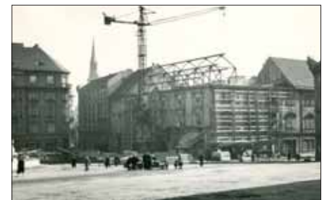
Oprava divadla Reduta, r. 1956