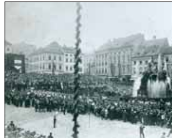
Slavnost při otevření vodovodu, r. 1913