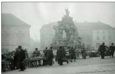
Tržiště v ranní mlze, po r. 1945