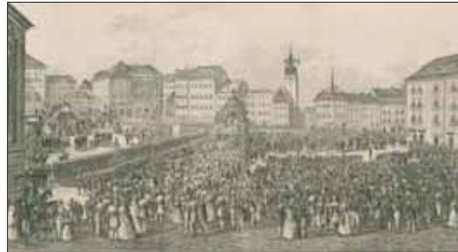
Slavnostní svěcení praporu měšťanského sboru, r. 1845