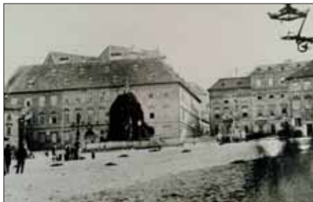
Parnas porostlý břečfanem, muzeum, nad ním Petrov bez věží, 2. polovina 19. stol.