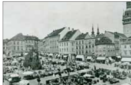
Domy na místě dnešní tržnice, r. 1907