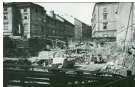
Odklizení základů starých domů před stavbou tržnice, r. 1948