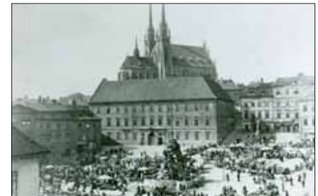
Tržiště počátkem 20. století