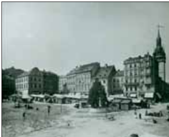
Tržiště, r. 1907