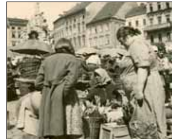
Stánky s drůbeží, r. 1939