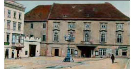
Divadlo Reduta a masná tržnice - stála v místě dnešní Květinářské ulice, r. 1870