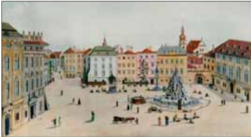
Pohled na dolní část náměstí - domy na místě pozdější Cyrilometodějské záložny, r. 1768