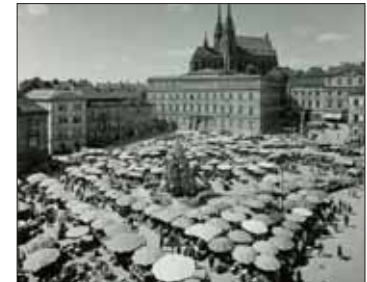
Pod slunečníky panuje čilý obchodní ruch, r. 1931