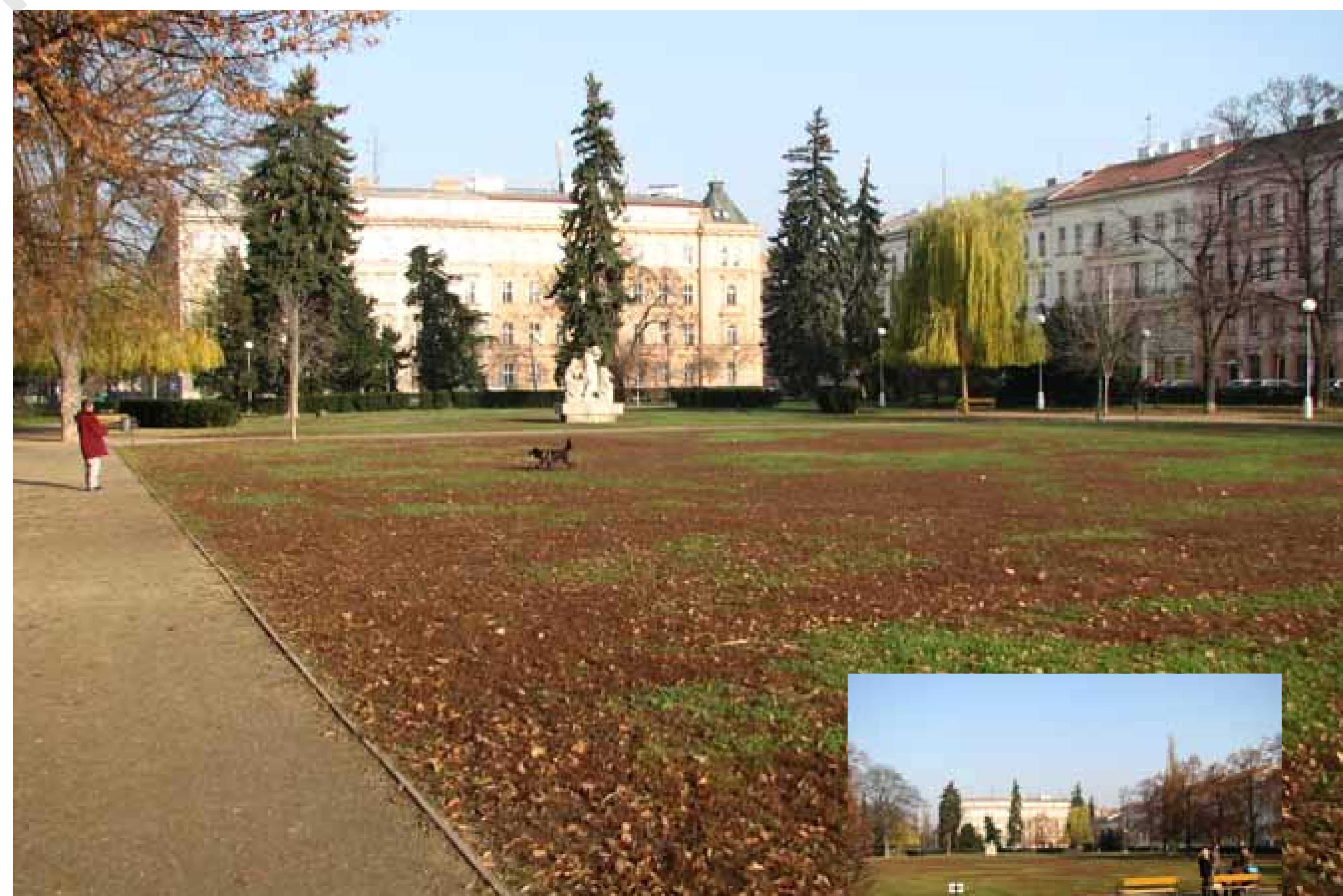
náměstí 28. října