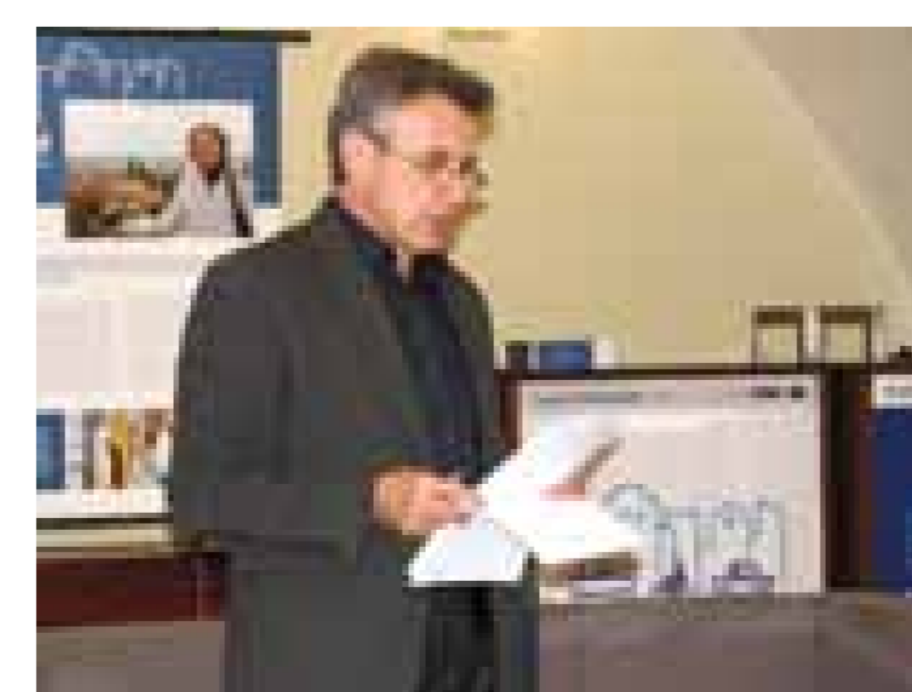
Seznámení s autory