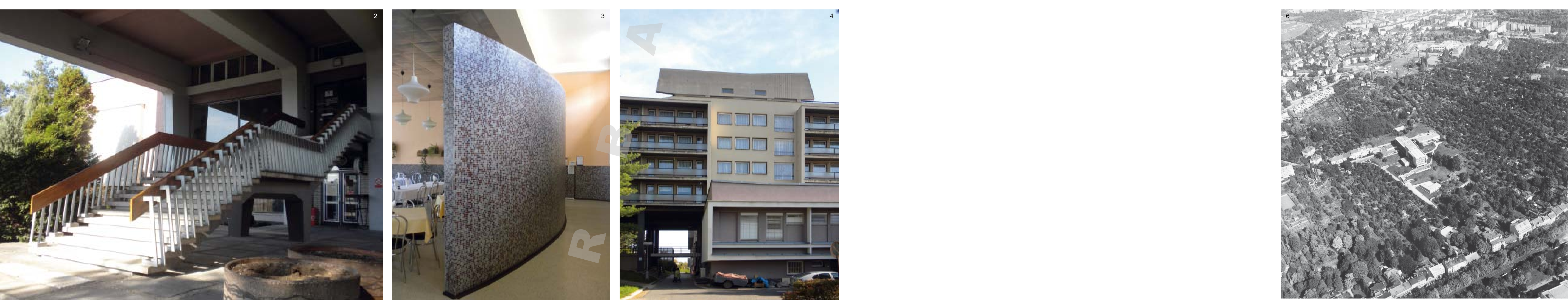
Pohled východní, původní dokumentace, 1965 Ostansicht, ursprüngliche Dokumentation, 1965