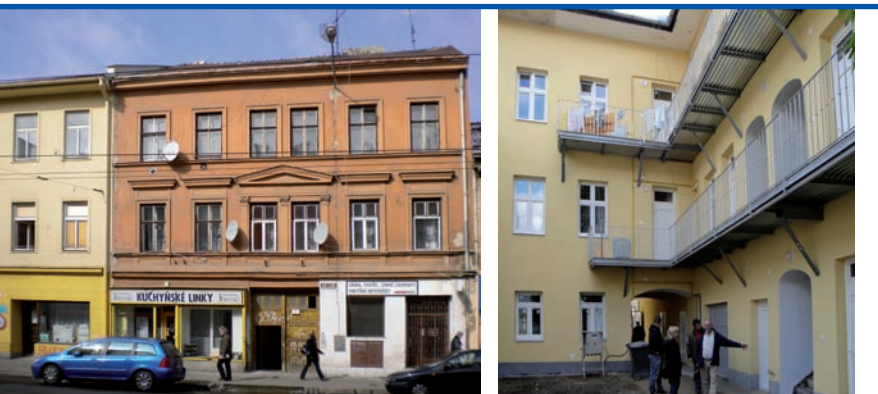
bytový dům z roku 1892