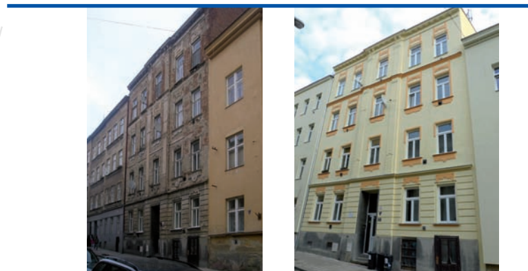
bytový dům z roku 1918