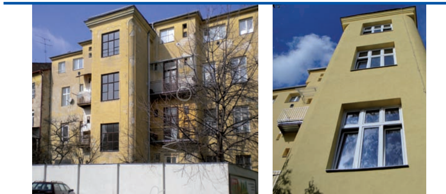
bytový dům z roku 1887