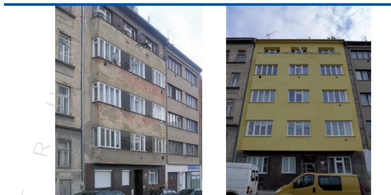
bytový dům z roku 1936