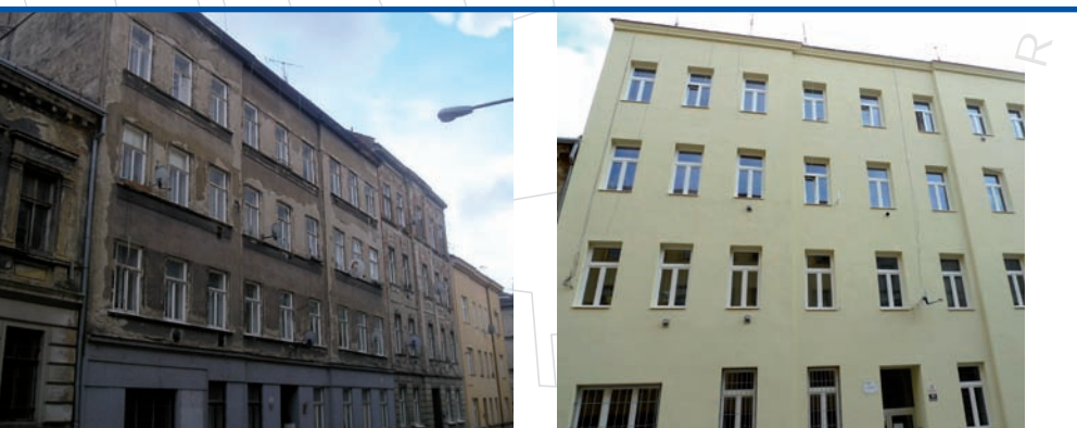
bytový dům z roku 1912