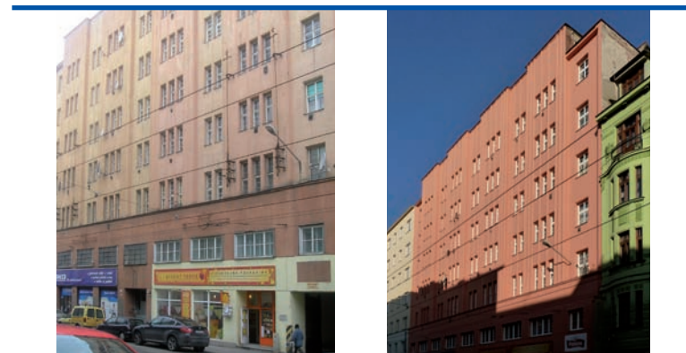
bytový dům z roku 1926