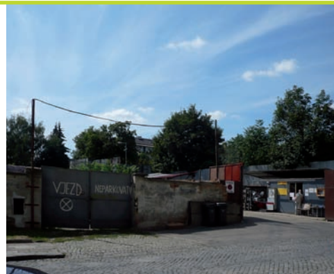
◀ před rekonstrukcí ▶ po rekonstrukci