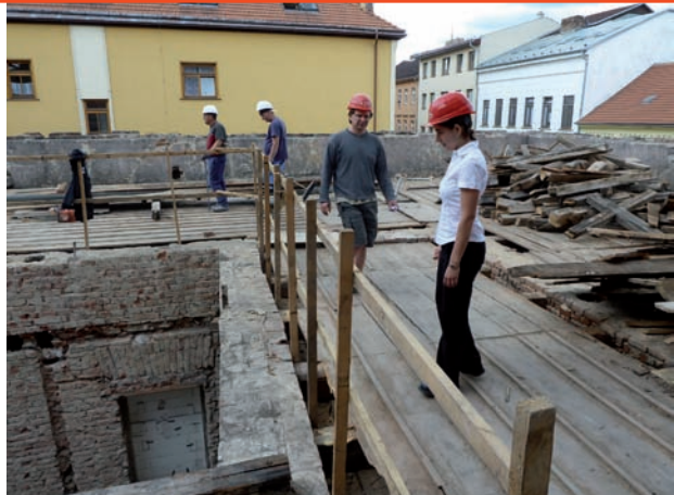
bytový dům SPOLKOVÁ 3