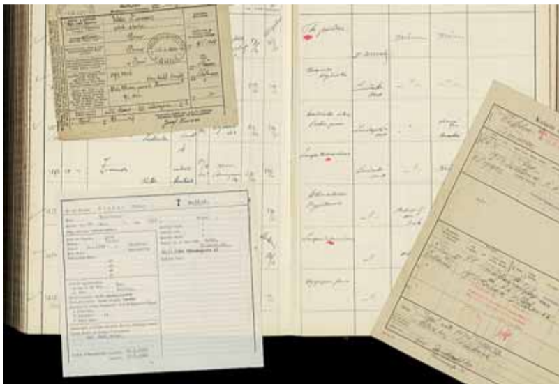
Ukázky z osobních evidenčních fondů uložených v Archivu města Brna.

Hlavním smyslem archivu je nejen shromažďování archivních dokumentů, jejich zpracování a péče o kvalitní uložení, ale především vytvoření podmínek pro zpřístupnění dokumentů pro veřejnost.