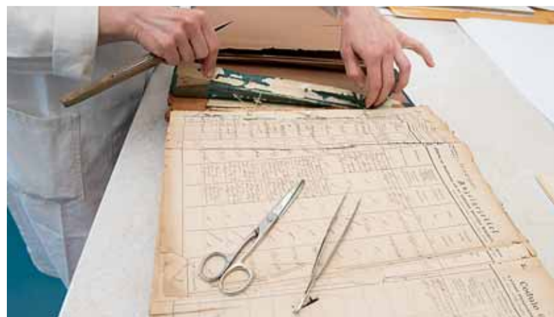
Restaurátorka rozešívá vazbu rukopisu sčítání lidu.

latinkou, křestní jméno, povolání a ulice s číslem popisným jsou psány tzv. kurentem (novogotickým kurzivním písmem). Sčítací archy jsou dvojazyčné formuláře vyplněné německy a psané opět kurentem. Úvodní strana obsahuje informace o zemi sčítání (v našem případě Morava), politickém okresu, obci, ulici, číslu domu a o celkovém počtu osob v domě. Násle-