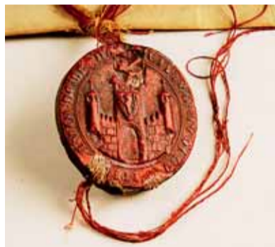
Nejstarší pečeť města Brna.

gameny jsou zpečetěny pečeti vydavatele z přírodního vosku na červených, žlutých a bílých hedvábných nitích. Je zde uložena také proslulá Právní kniha písaře Jana, sepsaná po roce 1355, podle níž se Brno řídilo až do roku 1697.