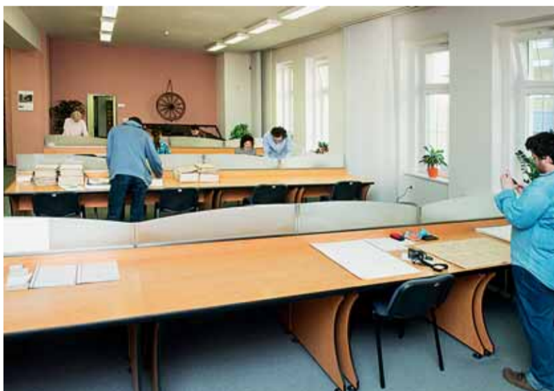
Badatelna na Přední 2.

B | R | N | O | žít brno... v minulosti a dnes