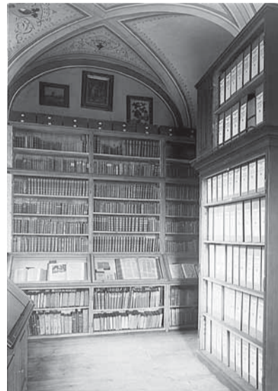
Depozitáře na Nové radnici (20. léta 20. století).

žitě usiloval o získání nových prostor. V té době byly již archiválie roztroušeny po 14 různých objektech, mnohdy nevhodně uloženy, a tudíž i poškozovány.