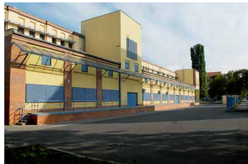
Nové sídlo Archivu města Brna na Přední 2.

Jde o výčet svobod, zákonů a práv, které český panovník městu udělil. Oba per-