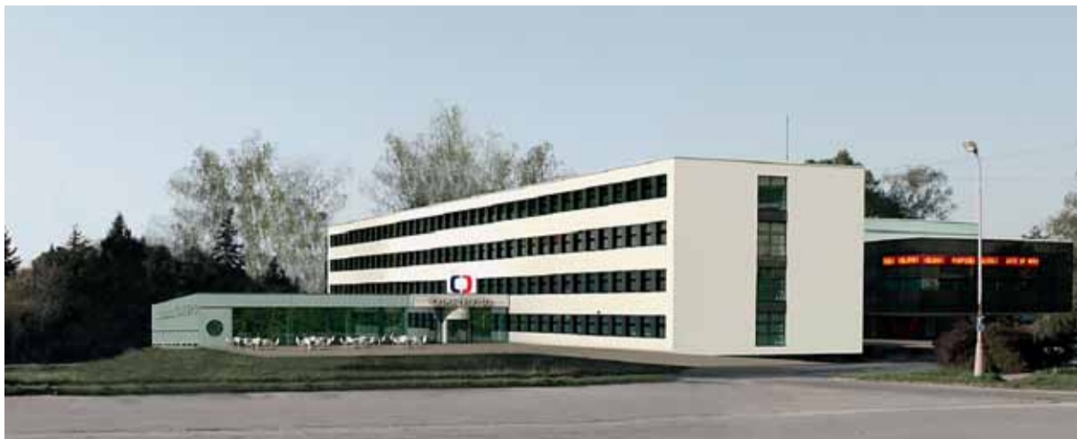
V části původního areálu Zetoru vyroste studio České televize Brno.