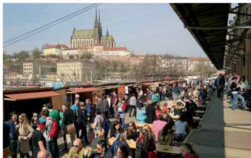
Malou Ameriku oživily také trhy a free markety.