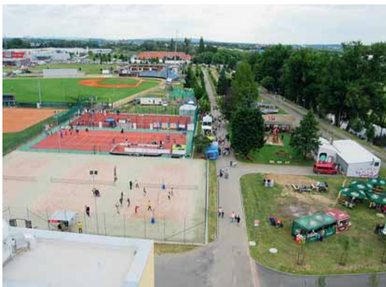
Areál na Hněvkovského láká ke sportovním aktivitám.