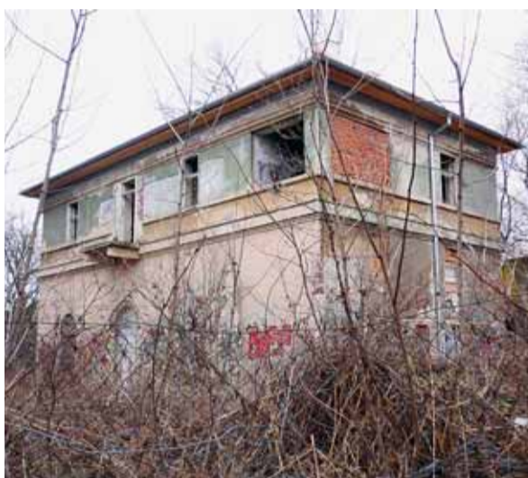
Historická budova z 18. století dlouho chátrala.