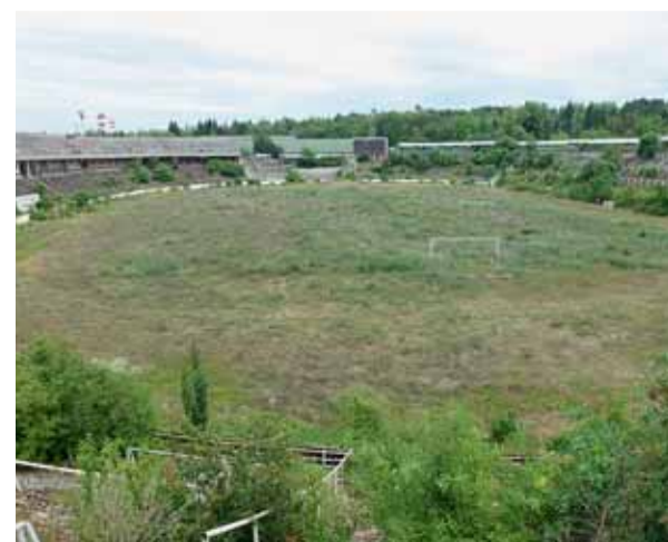
Za Lužánkami vyrostla džungle.

Rada města Brna v červenci 2015 schválila uzavření nájemní smlouvy s iniciativou Věříme Zbrojovce, družstvo fanoušků a Petra Švancary, jejímž cílem je údržba stadionu a pořádání sportovních a kulturních akcí.