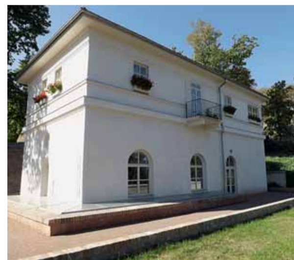
Dnes už Hlídka "prohlídla".

FOTO ARCHITEKTONICKÁ KANCELÁŘ RADKO KVĚT