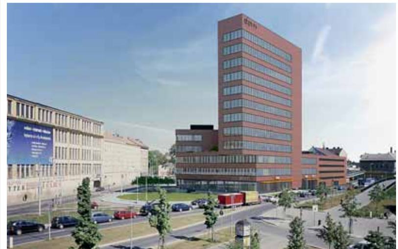
Polyfunkční objekt Dorn bude tvořit další dominantu.