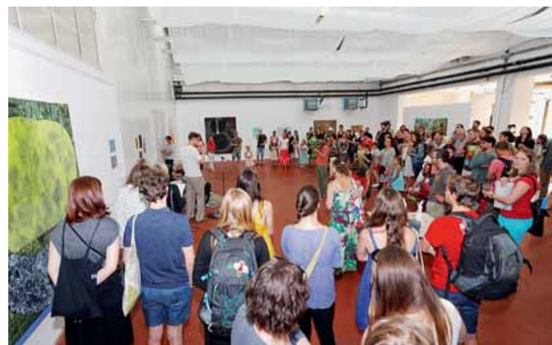
Industra přidává ke kulturním akcím "industriální atmosféru".

Projekt startoval v červnu 2012 a během krátké doby se dostal do povědomí veřejnosti. Uskutečňují se zde různé výstavy, worksho-