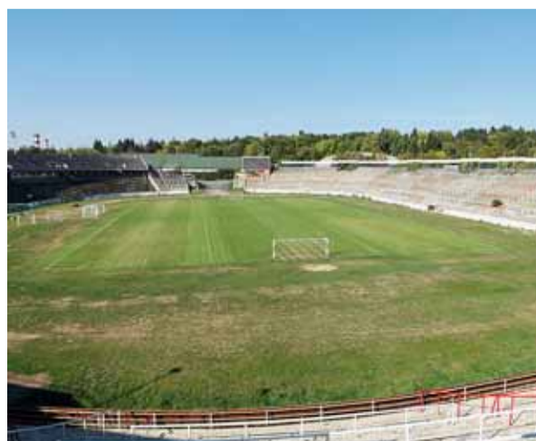
Trávník už se opět zelená fotbalově.