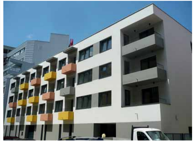
Nový dům s pečovatelskou službou souzní s okolní zástavbou.