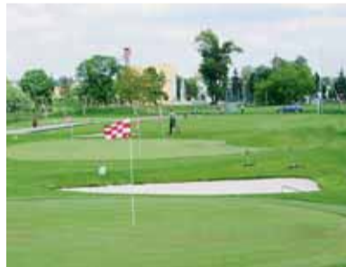
Kšírovka se stala prvním městským golfovým areálem.

Využití tohoto území pro sportovní aktivity je však pouze dočasné – a to do doby, než zde dojde k realizaci staveb (především pro bydlení a veřejnou vybavenost) dle platného Územního plánu města Brna.