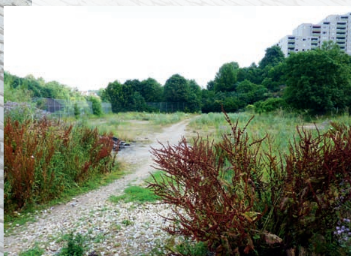
Stuttgart – místo pilotního projektu – potok Feuerbach v místě bývalých sportovišť

V letošním roce končí tříletý proces přípravy, v následujících letech by měla postupně navazovat realizace jednotlivých úseků v návaznosti na připravenost daného území.