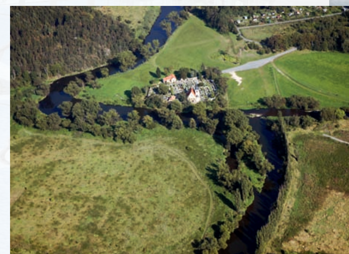
Plzeň – u Sv. Jiří (soutok Úslavy a Berounky v Doubravce)