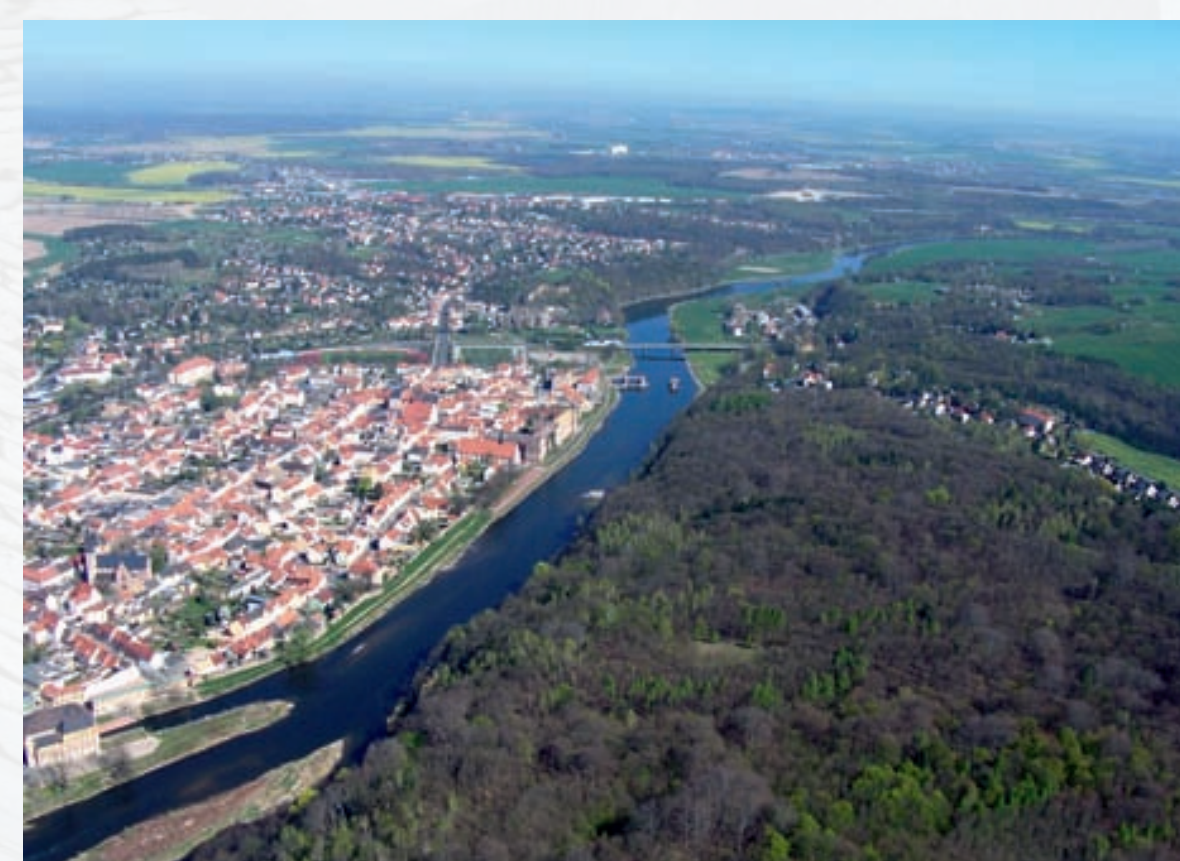
Univerzita Lipsko – město Grimma