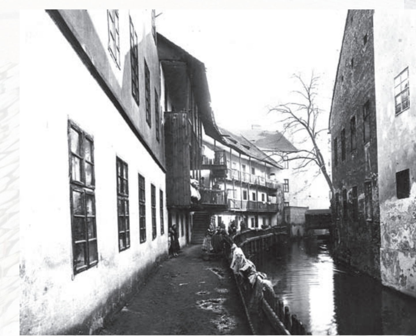
Malé Benátky na Dornychu r. 1906