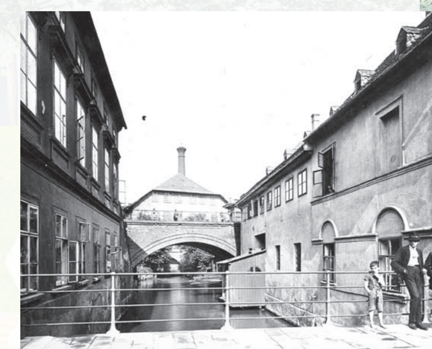
Bývalý Hasův dům - mlýn