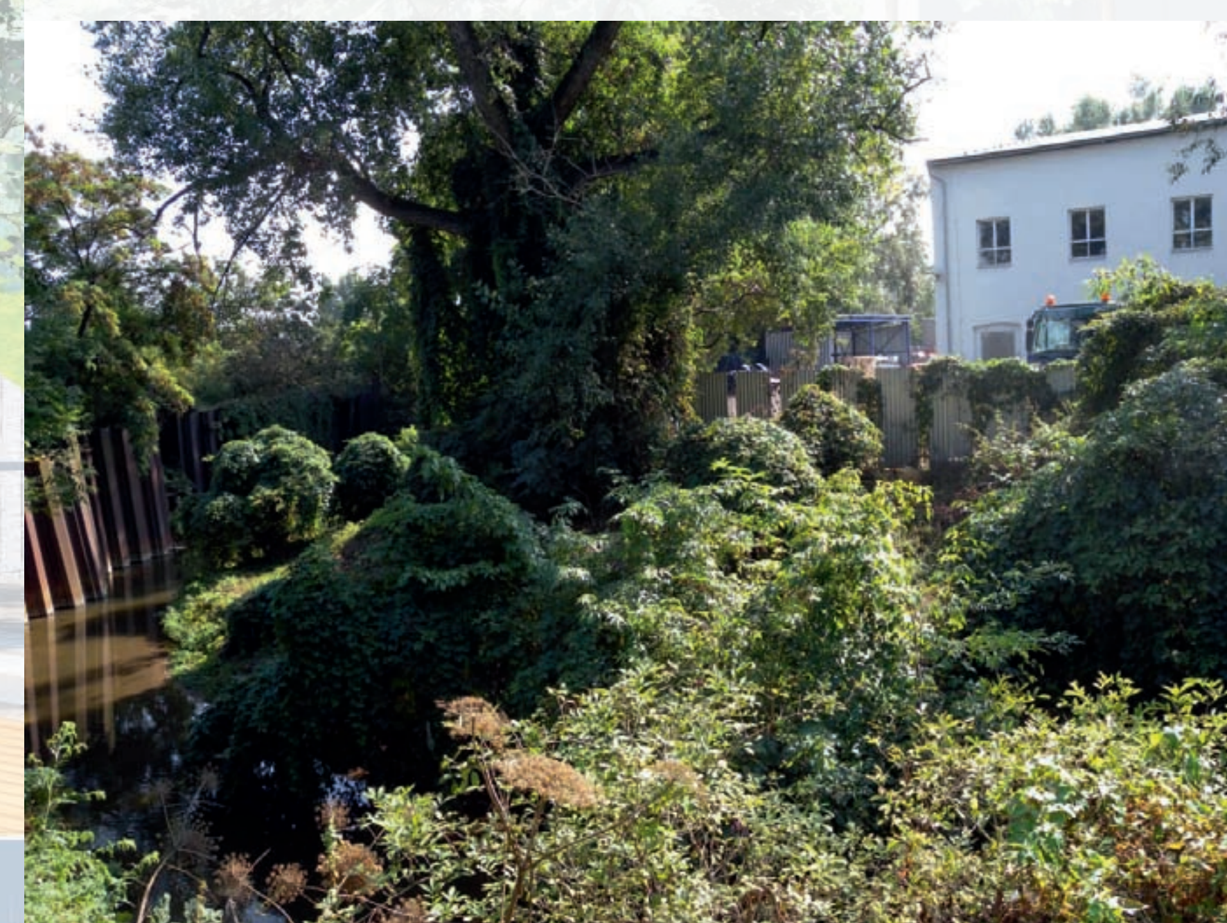
Spontánní vegetace za areálem bývalé Škrobárny