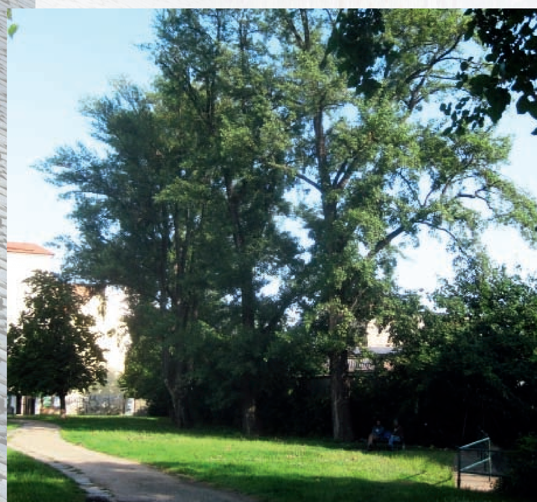
Topoly černé ( Populus nigra ) na ulici Dorných