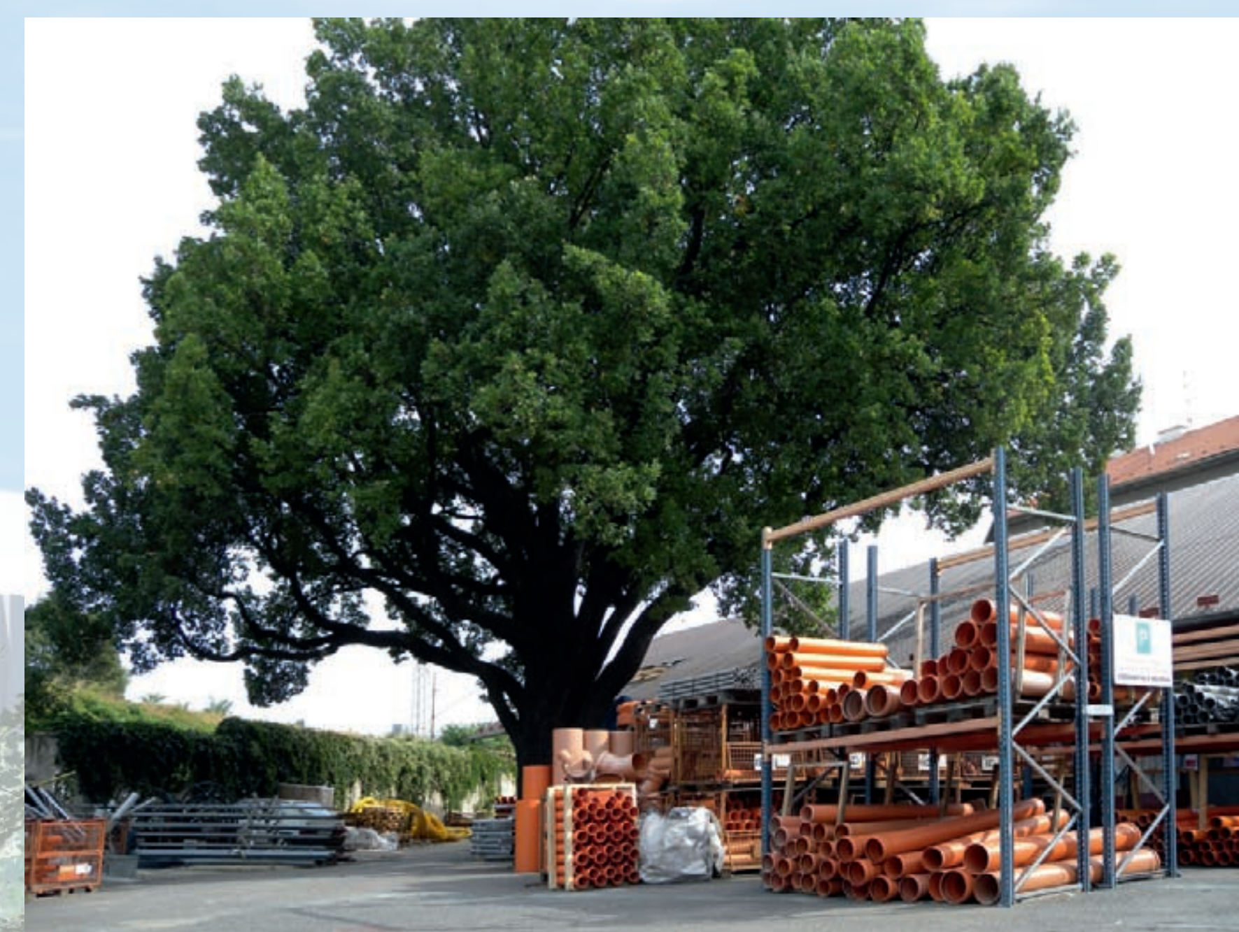
Dub letní ( Quercus robur ) v areálu firem na ulici Špitálka

V celé lokalitě podél Ponávky se nachází nespočet impozantních a hodnotných stromů.