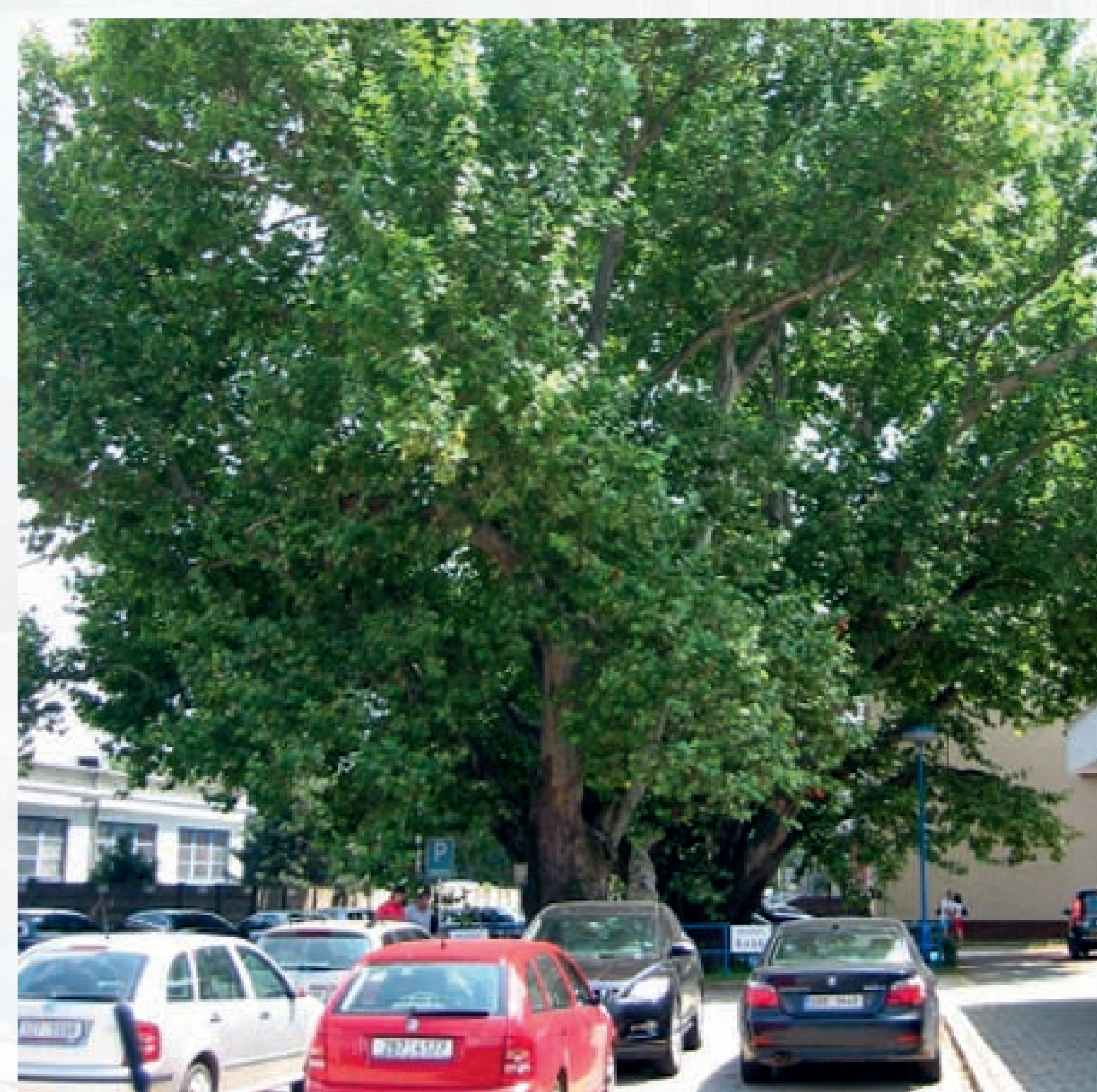
Dvojice chráněných platanů javorolistých, ( Platanus hispanica ), stáří 160 let. Areál firmy Setra