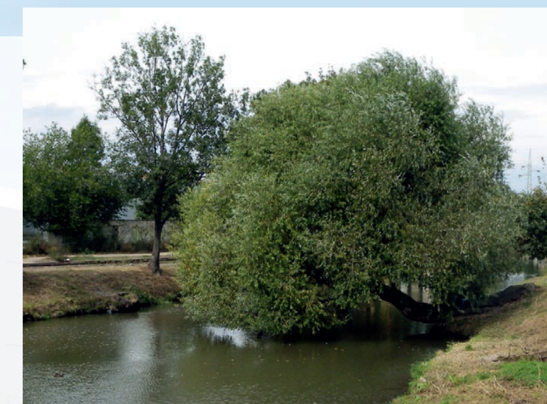
Vrba bílá ( Salix alba ) rostoucí na levém břehu Svitavy těsně nad jezem Radlas