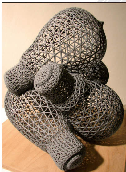
1. místo MgA. Tomáš Medek

Odborná komise 10. října 2007 vyhodnotila tyto autory: