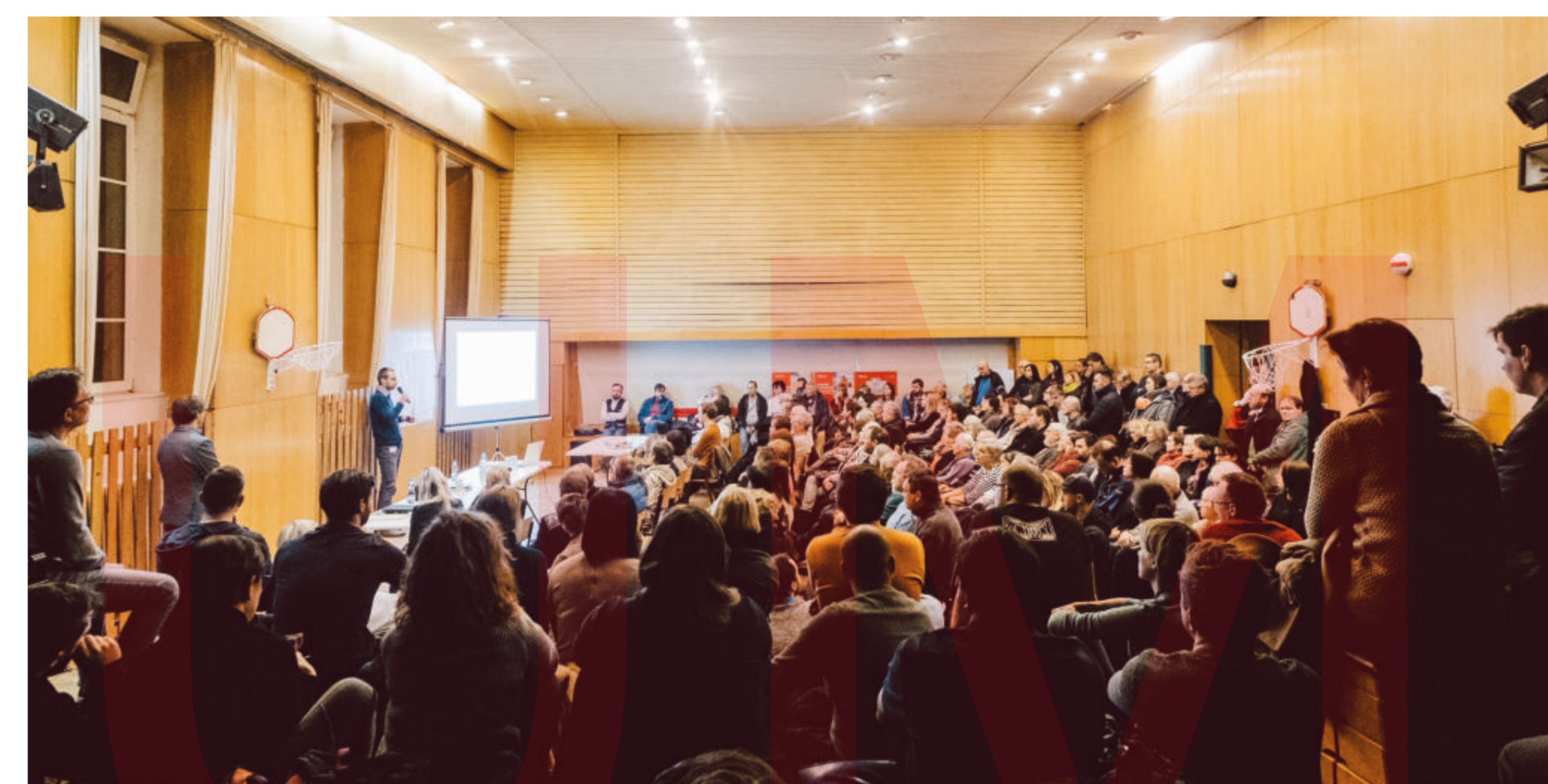
Setkání s veřejností se uskutečnilo ve čtvrtek 13. února 2020 v sále Cyrilometodějské církevní základní školy. Zúčastnilo se ho na dvě stě lidí.