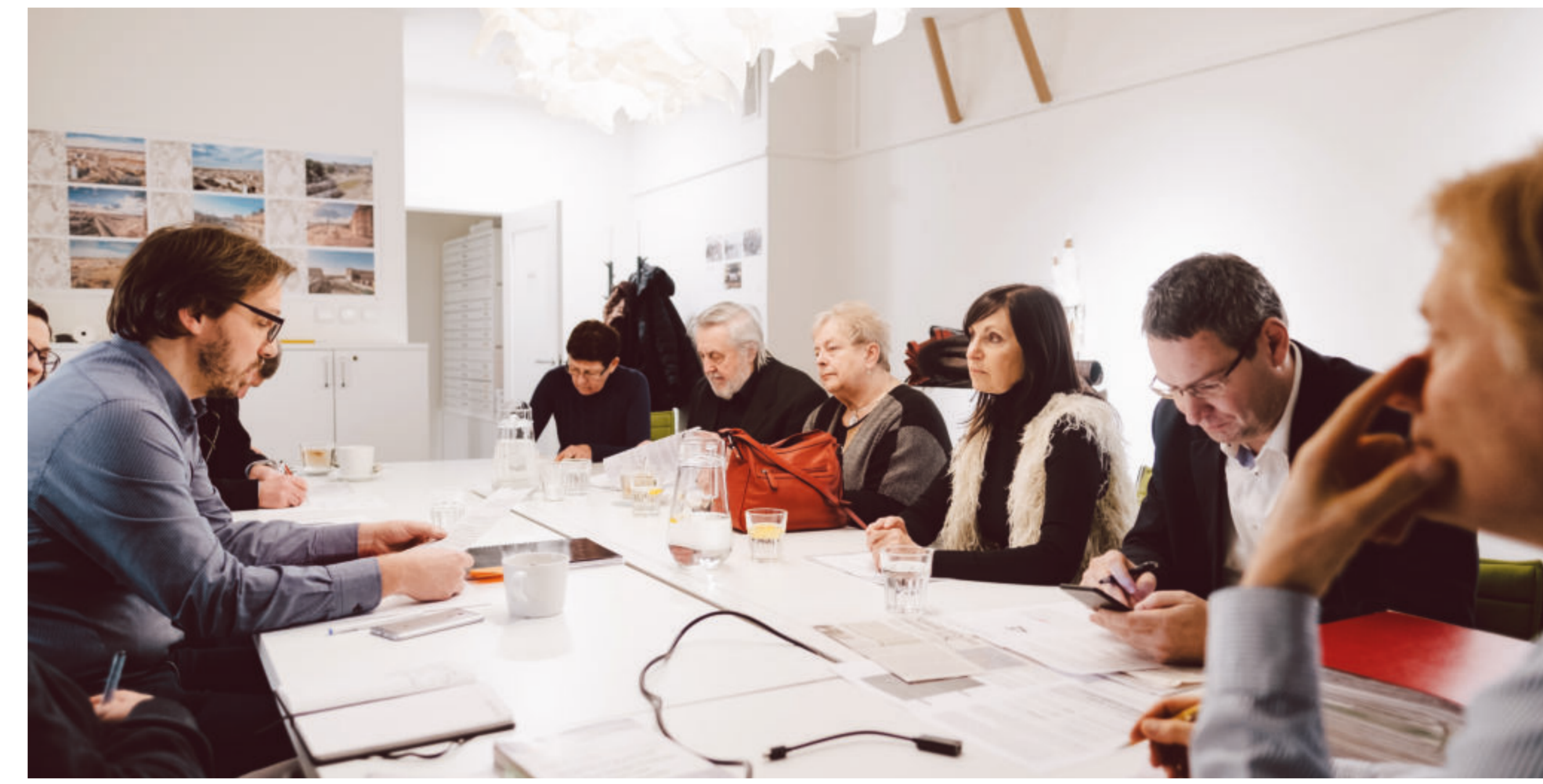
Od začátku přípravy soutěže jsme v Kanceláři architekta města Brna jednali se zástupci místních občanských spolků.

Pochopili jsme, že najít kompromis bude velmi obtížné, jelikož v zásadních věcech se různé skupiny občanů neshodly. Proto jsme jednali dál a některé vyhraněné názory se nám podařilo zmírnit. Některé se vzájemně vylučovaly, nebo byly neproveditelné z jiných důvodů. Při přípravě zadání soutěže jsme proto zohlednili výsledek přínosný pro co největší skupinu občanů.