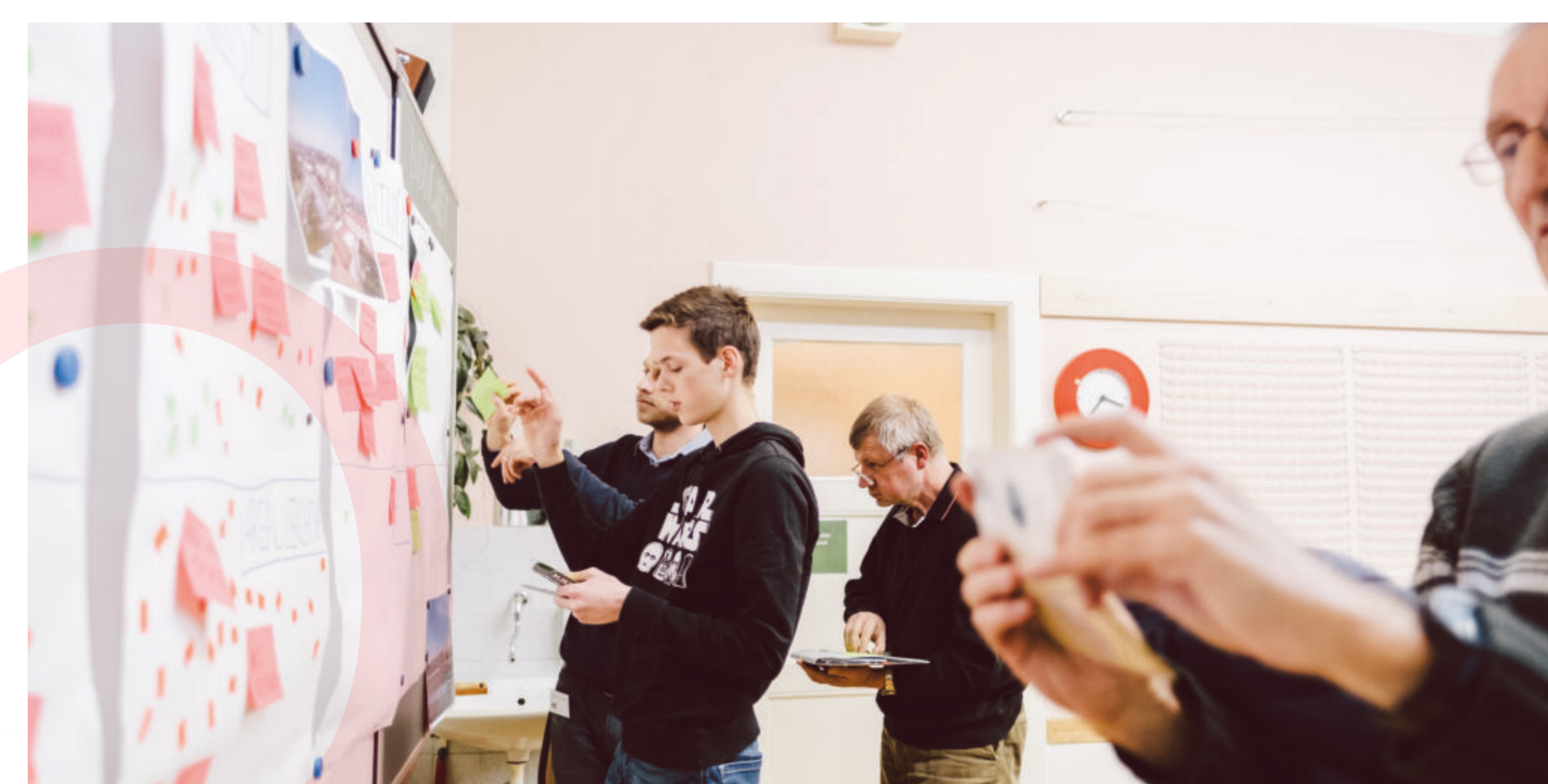
Účastníci participace byli rozděleni do čtyř skupin, aby tak každý dostal prostor vyjádřit svůj názor. Kompletní shrnutí výstupů najdete na kambrno.cz/namesti-miru .