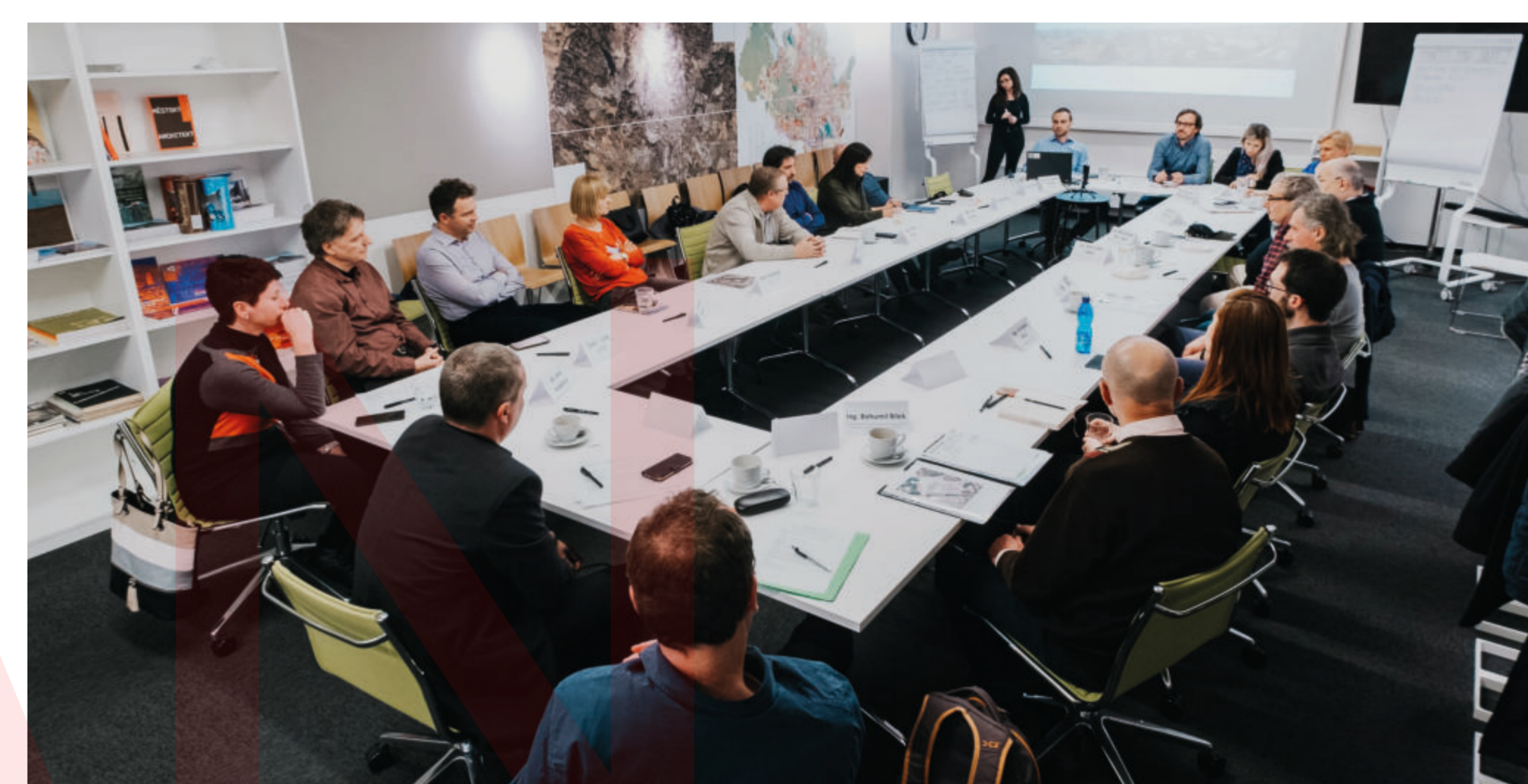
Začátkem února 2020 jsme uspořádali kulatý stůl s klíčovými aktéry, majiteli a uživateli okolních objektů, zástupci městské části, městských firem, odborů magistrátu i občanských spolků.