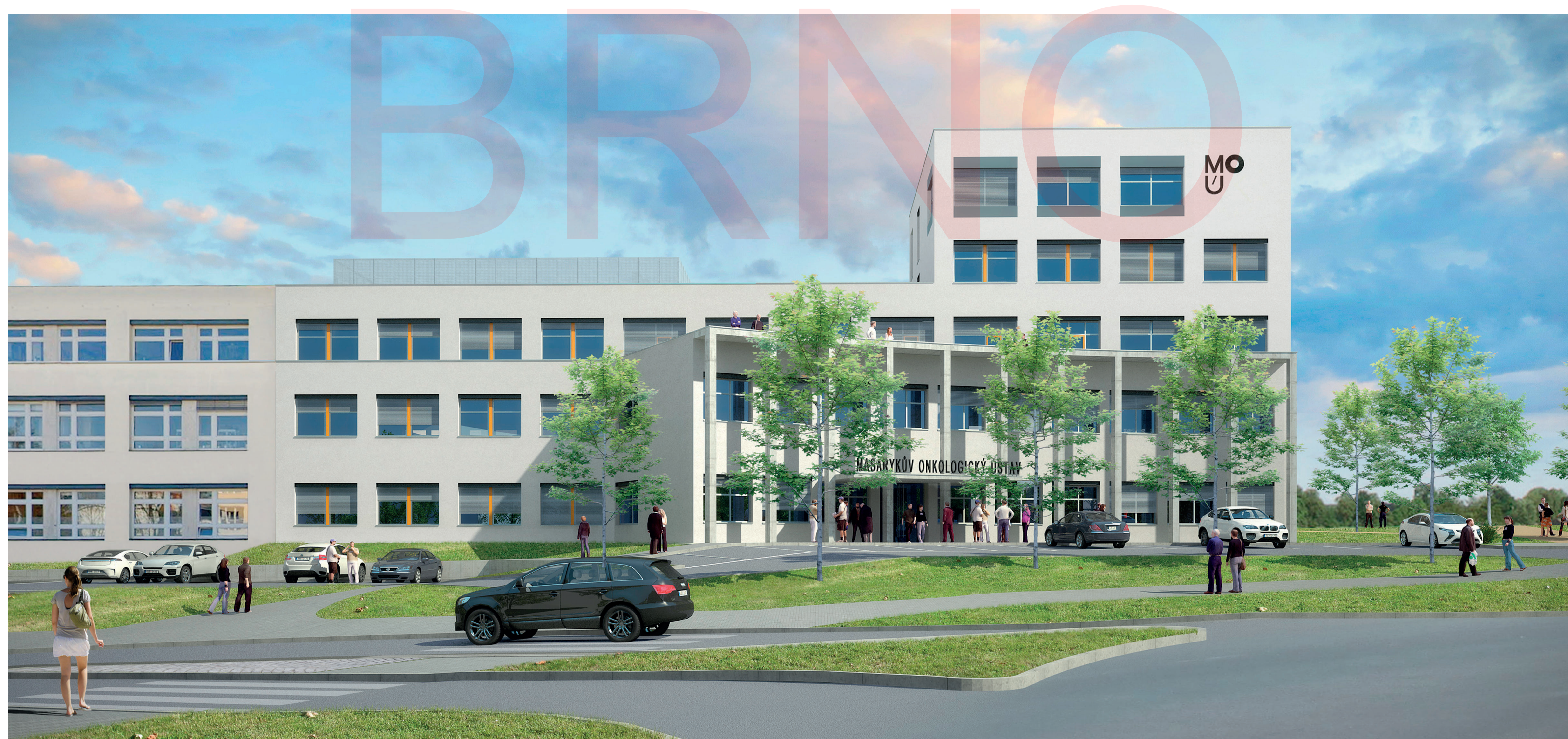
Vizualizace Centra prvního kontaktu | Burian-Křivinka Architects