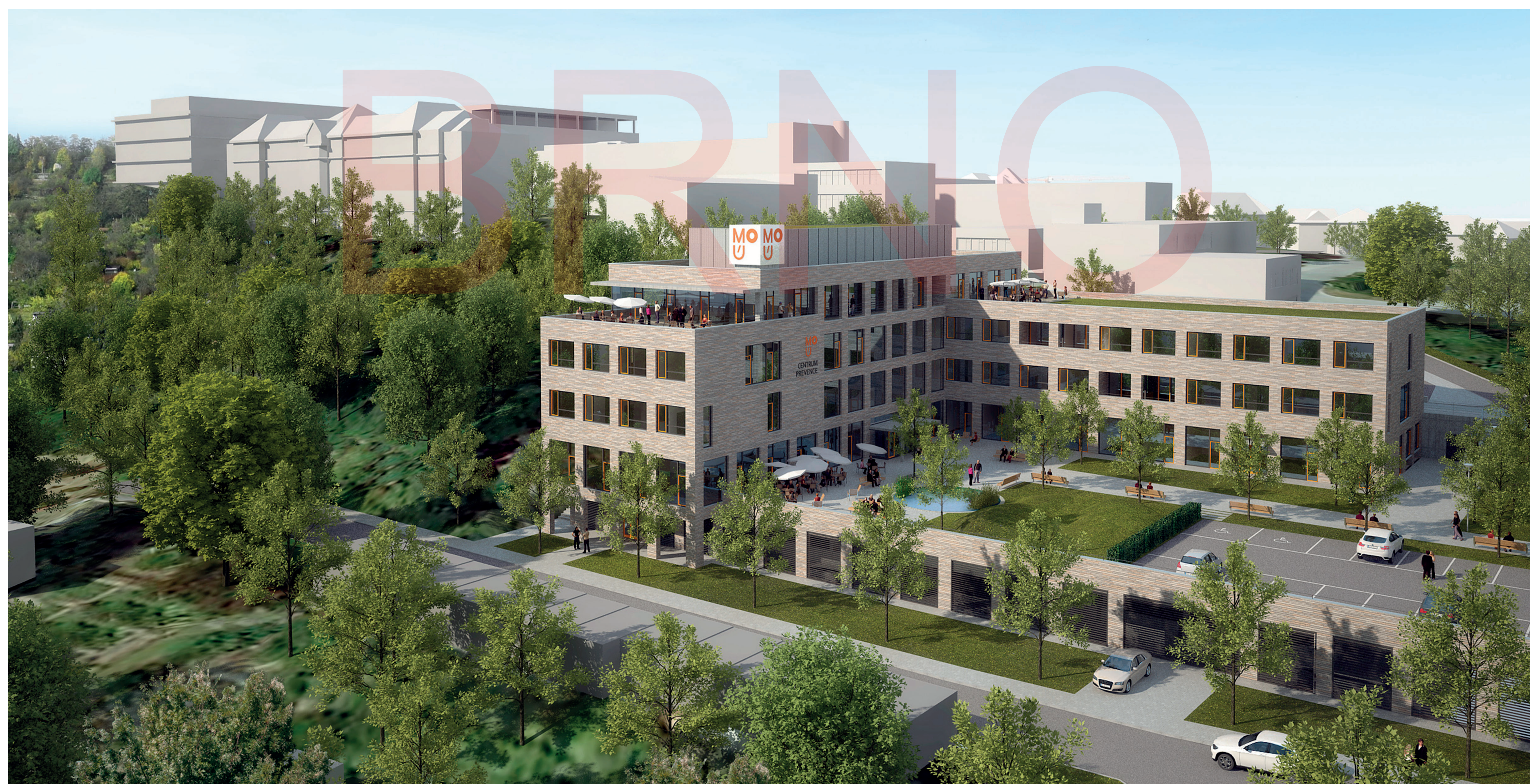
Vizualizace Centra onkologické prevence | Burian-Křivinka Architects