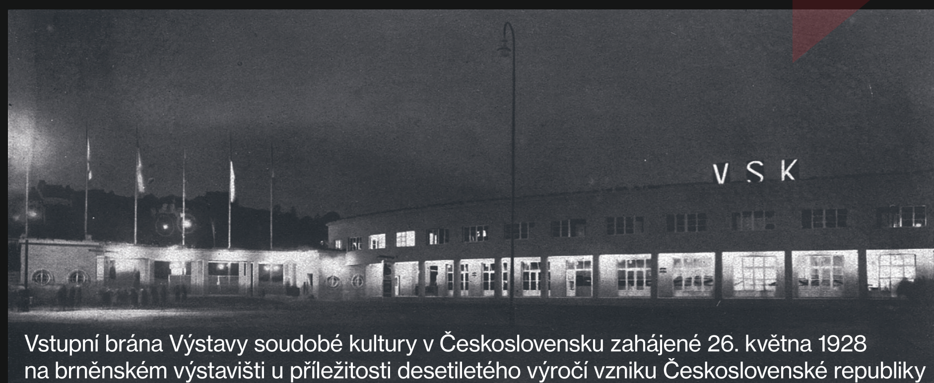
Vstupní brána Výstavy soudobé kultury v Československu zahájené 26. května 1928 na brněnském výstavišti u příležitosti desetiletého výročí vzniku Československé republiky