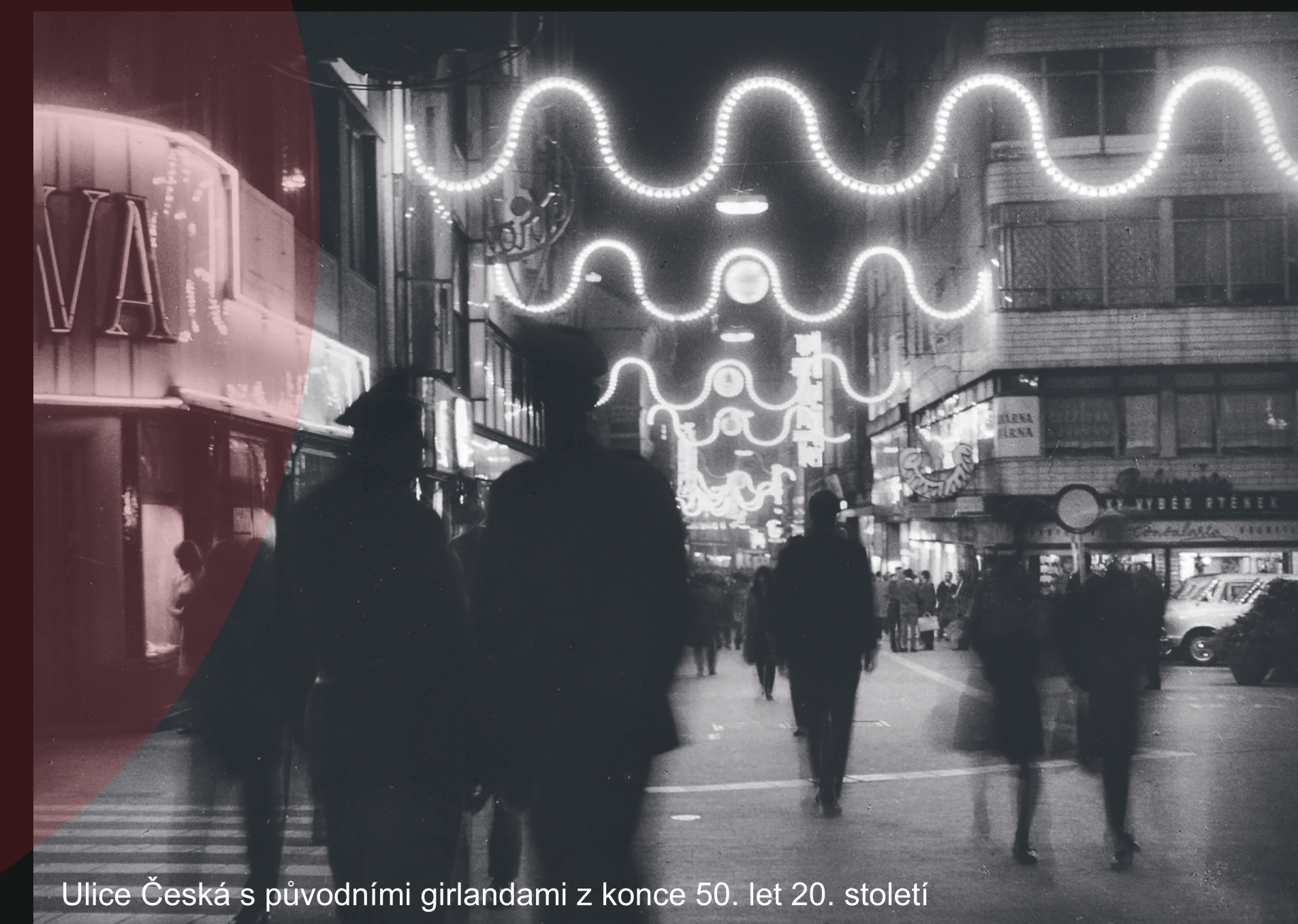
Ulice Česká s původními girlandami z konce 50. let 20. století