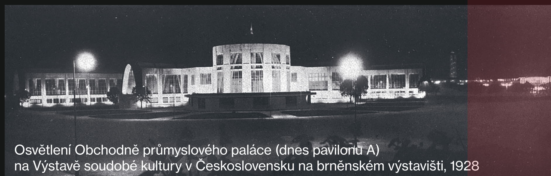
Osvětlení Obchodně průmyslového paláce (dnes pavilónů A) na Výstavě soudobé kultury v Československu na brněnském výstavišti, 1928

Během více než sedmdesátiletého provozu a po několika renovacích však girlandy postupně ztrácely svůj původní specifický charakter. V letech 2006—2008 byly v rámci jejich úprav vyměněny klasické žárovky za elektroluminiscenční diody — LED. Město Brno se následně rozhodlo namísto další nutné rekonstrukce přistoupit k nahrazení stávajícího osvětlení osvětlením novým. Uspořádáním designérské soutěže tak navazuje na dlouholetou tradici zdejších světelných girland, které k městu neodmyslitelně patří a které zpříjemňují zážitek z chůze i z pobytu ve veřejném prostoru.