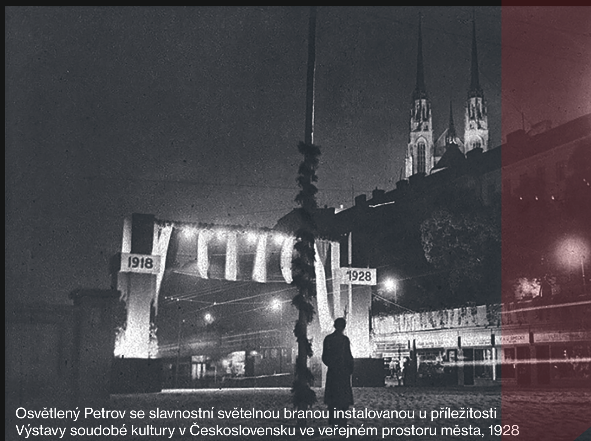
Osvětlený Petrov se slavnostní světelnou branou instalovanou u příležitosti Výstavy soudobé kultury v Československu ve veřejném prostoru města, 1928