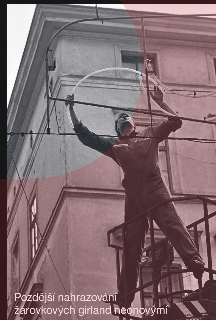
Pozdější nahrazování žárovkových girland neony