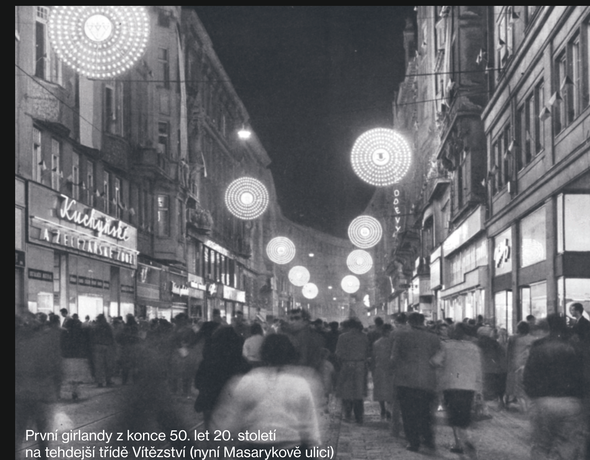
První girlandy z konce 50. let 20. století na tehdejší třídě Vítězství (nyní Masarykově ulici)