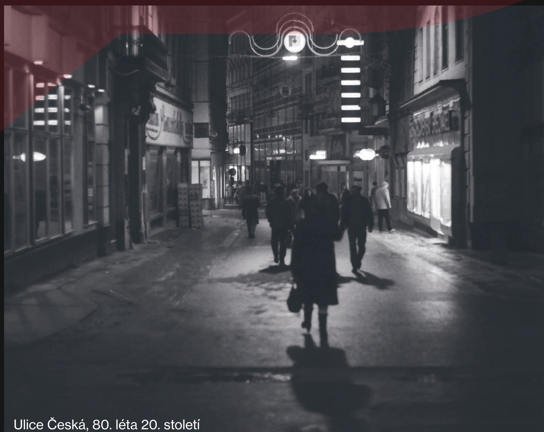
Ulice Česká, 80. léta 20. století