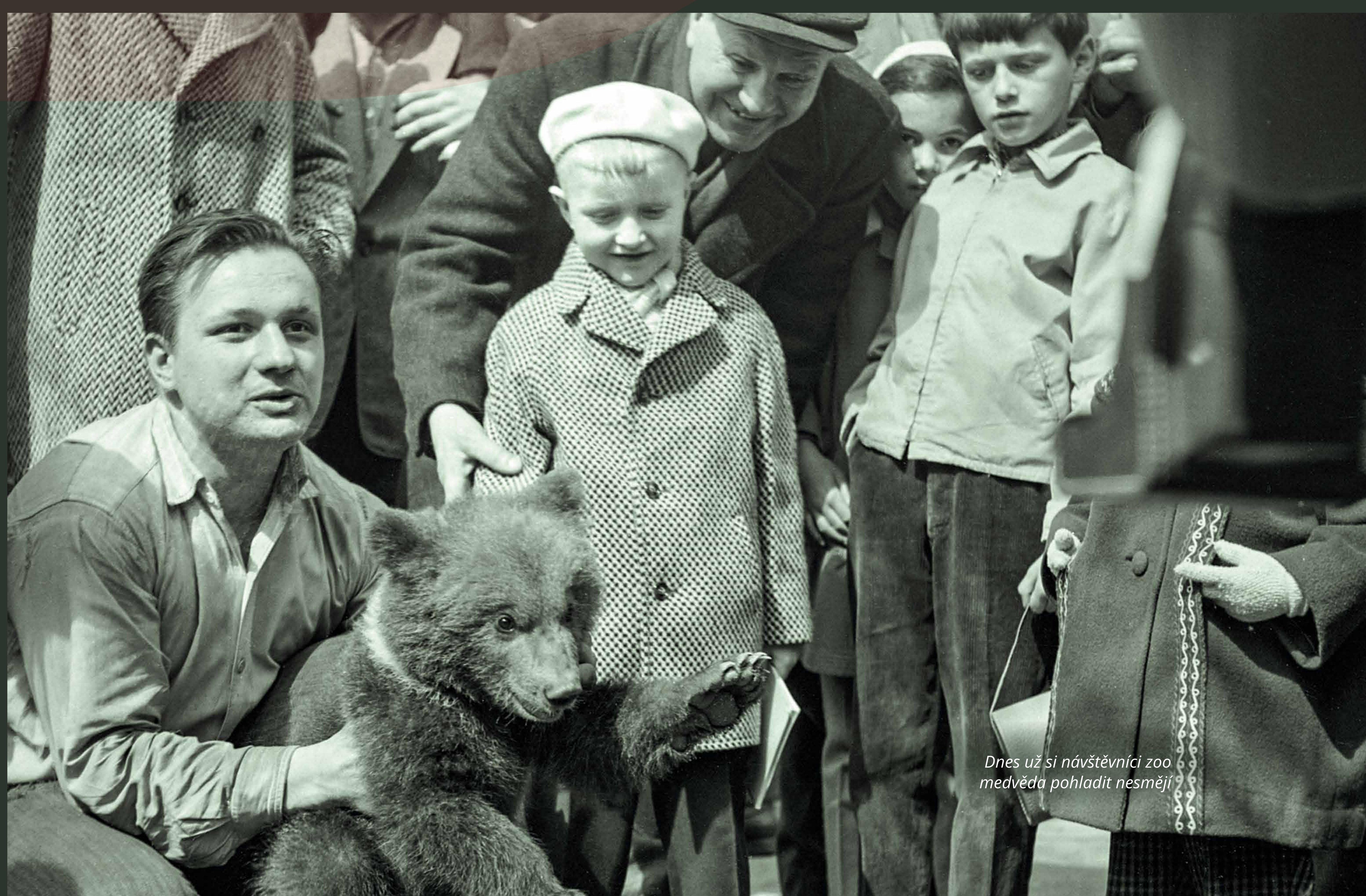
Dnes už si návštěvníci zoo medvěda pohladit nesmějí