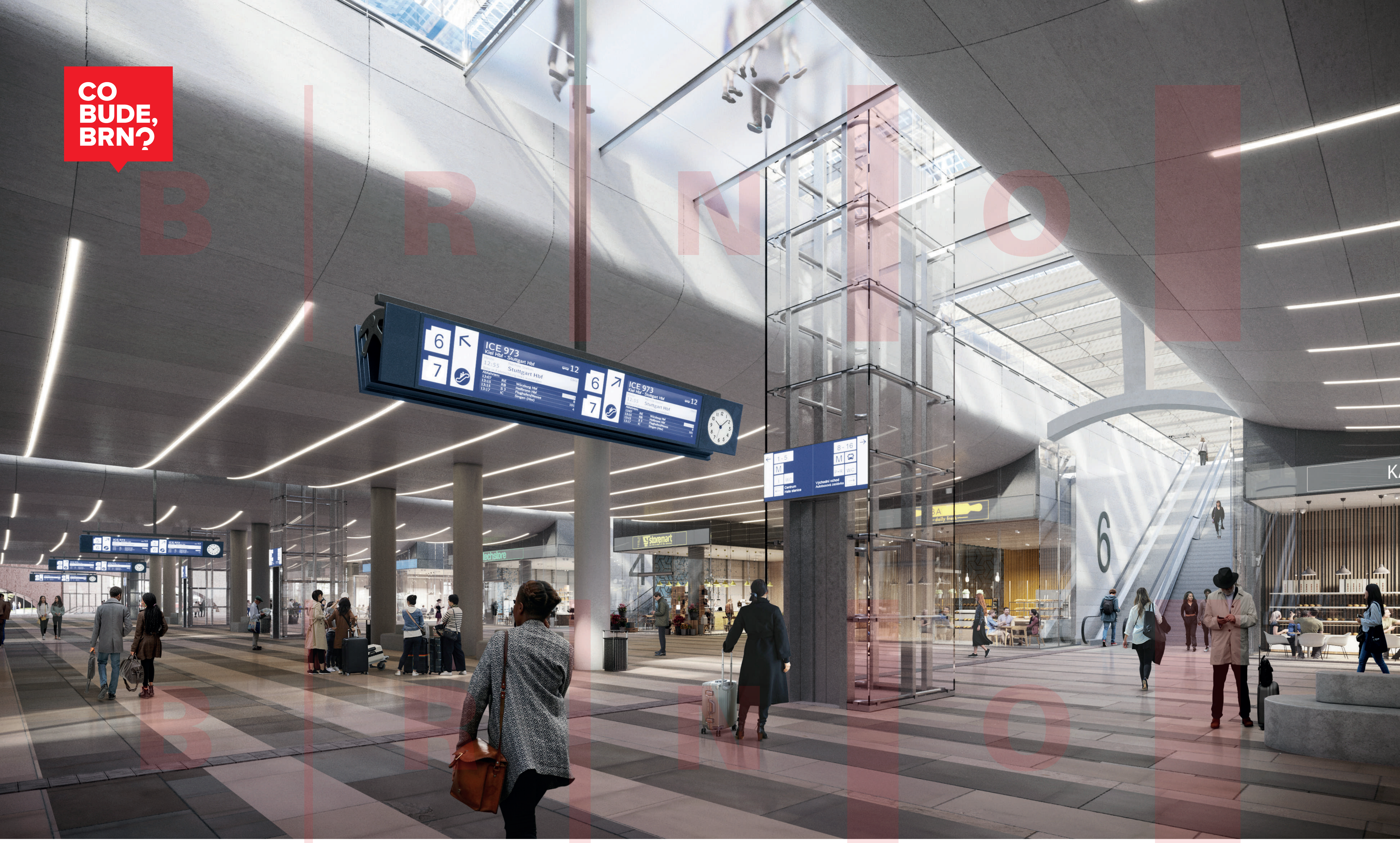
HLAVNÍ PASÁŽ MAIN CONCOURSE