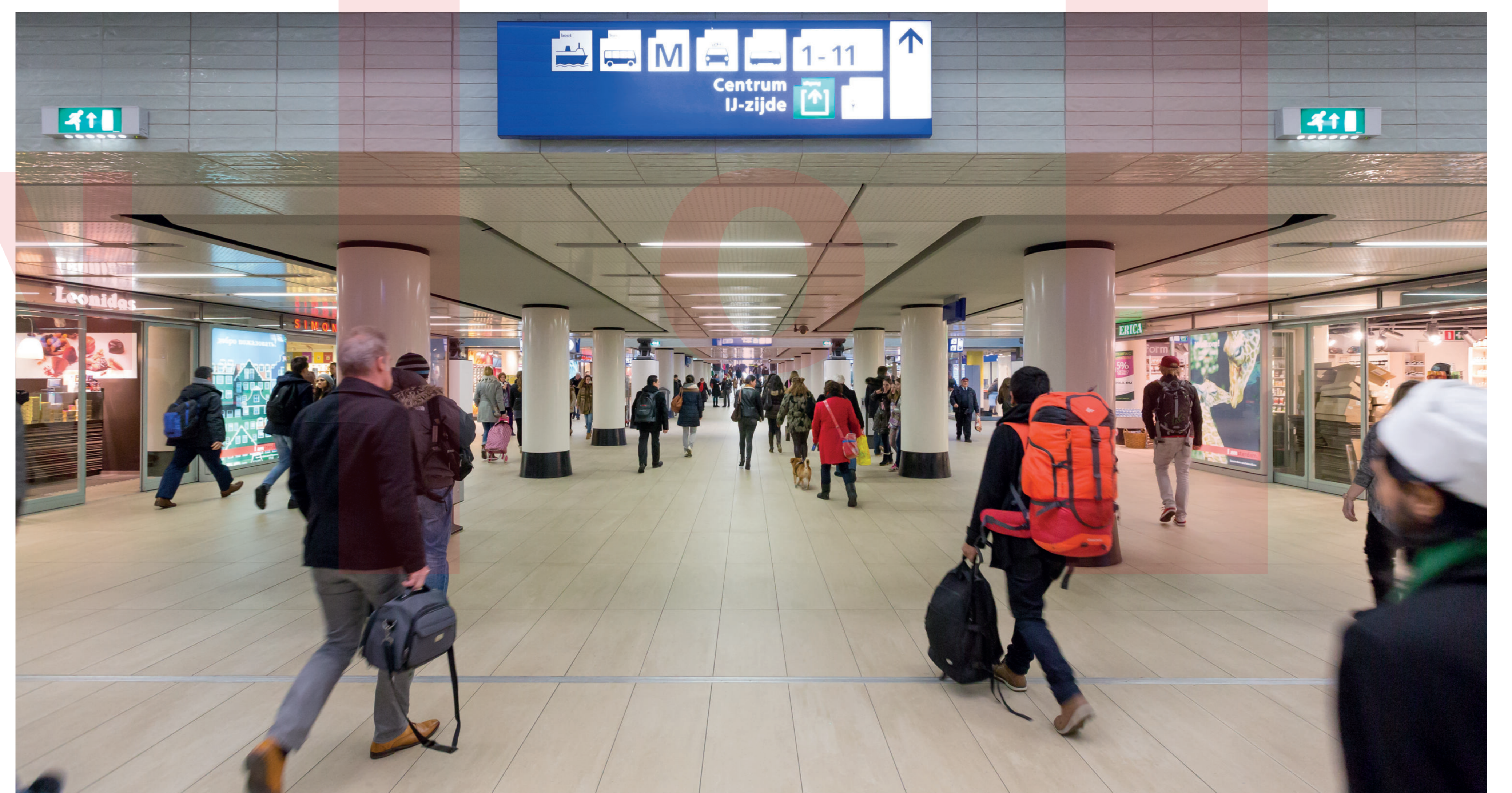
HLAVNÍ PASÁŽ MAIN CONCOURSE