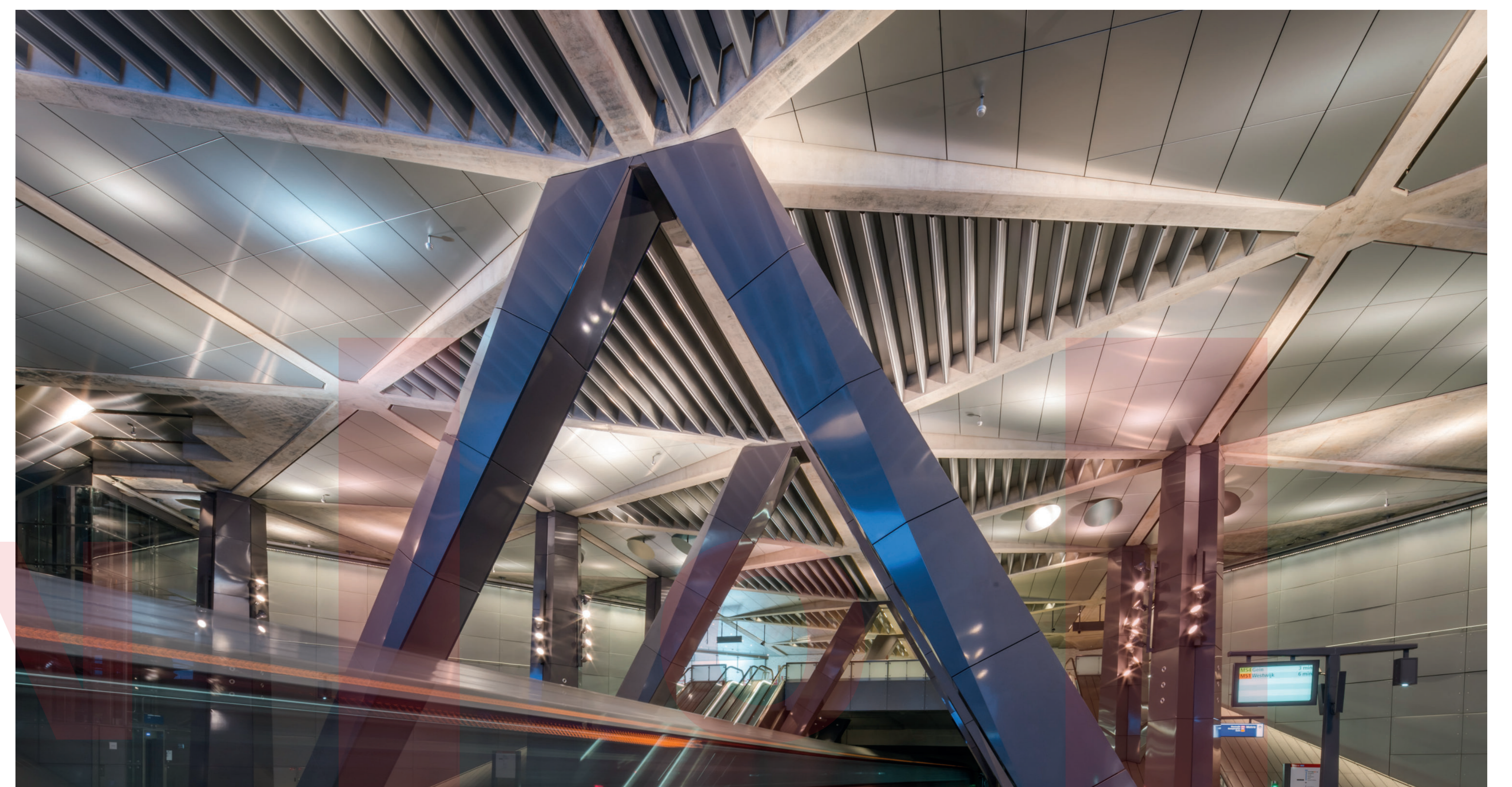
STANICE METRA METRO STATION