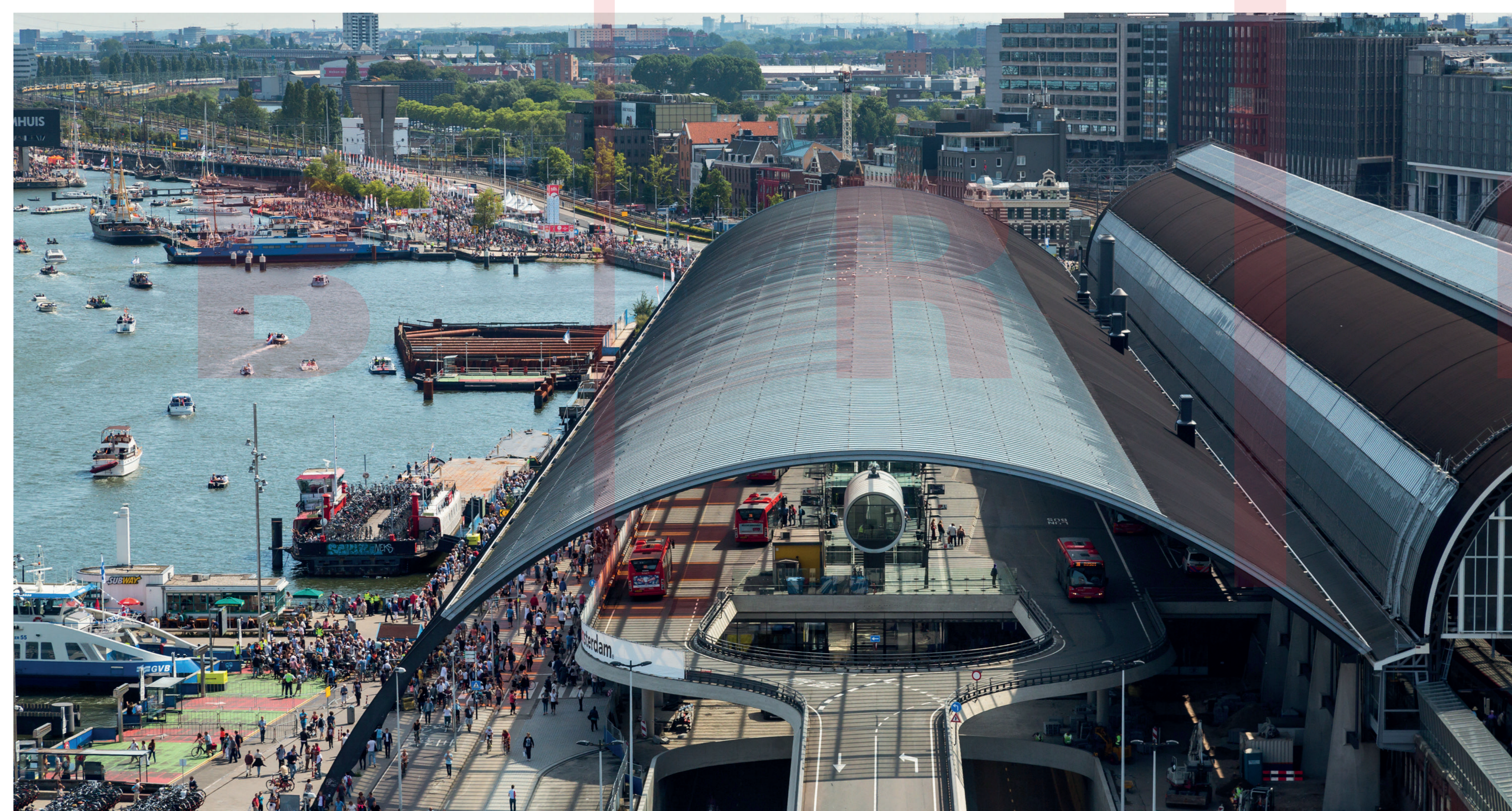
AUTOBUSOVÉ NÁDRAŽÍ BUS STATION