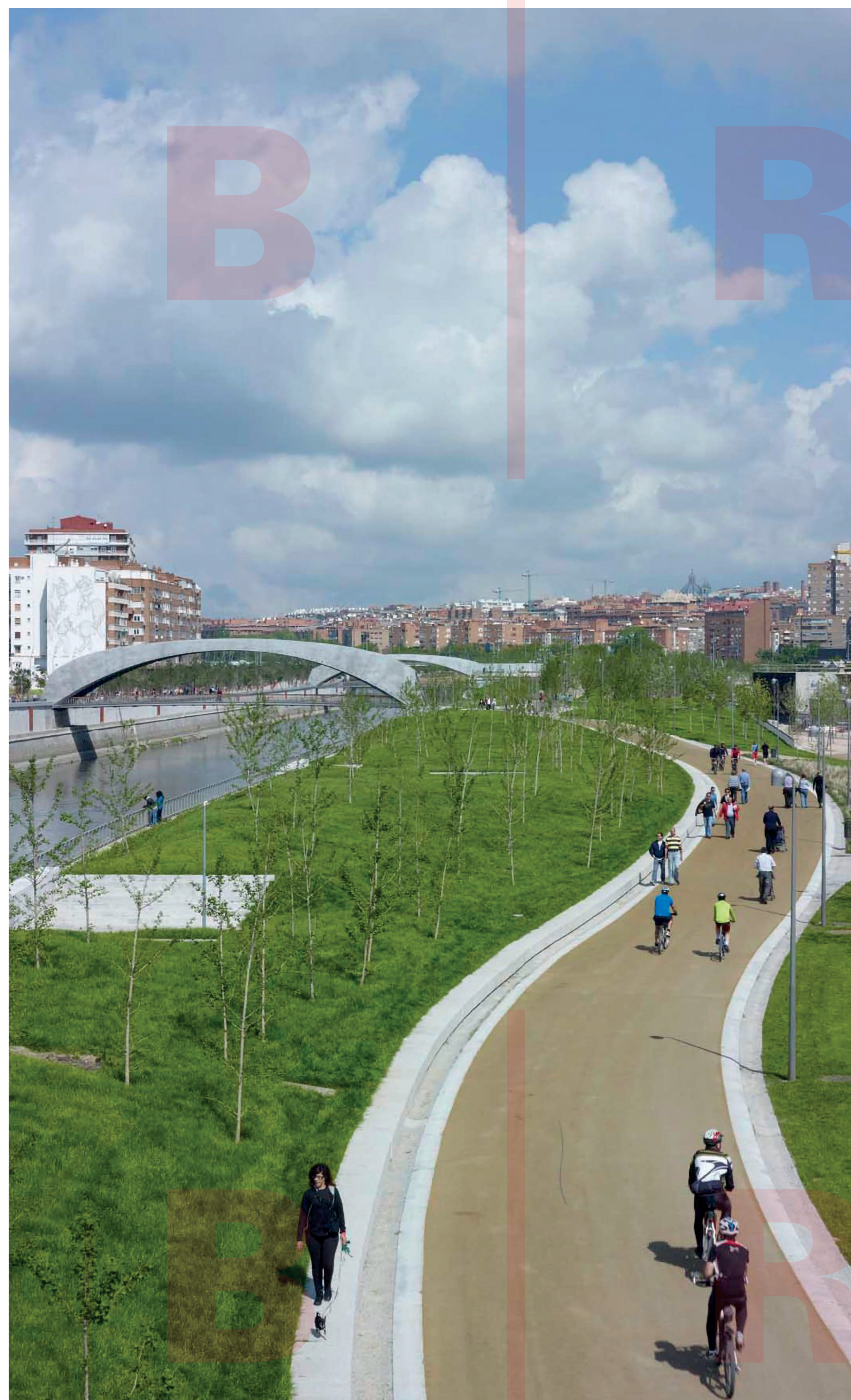
CYKLOSTEZKA BIKE LANE

Madrid RIO is a living landscape on an inert underground substrate. As one of the biggest “urban mat-building” in the world – vegetation was the main material used on top of the structure to create a dense and ecological environment – it is perhaps one of the projects that best integrates large infrastructures and the built urban fabric with the natural environment that surrounds it.