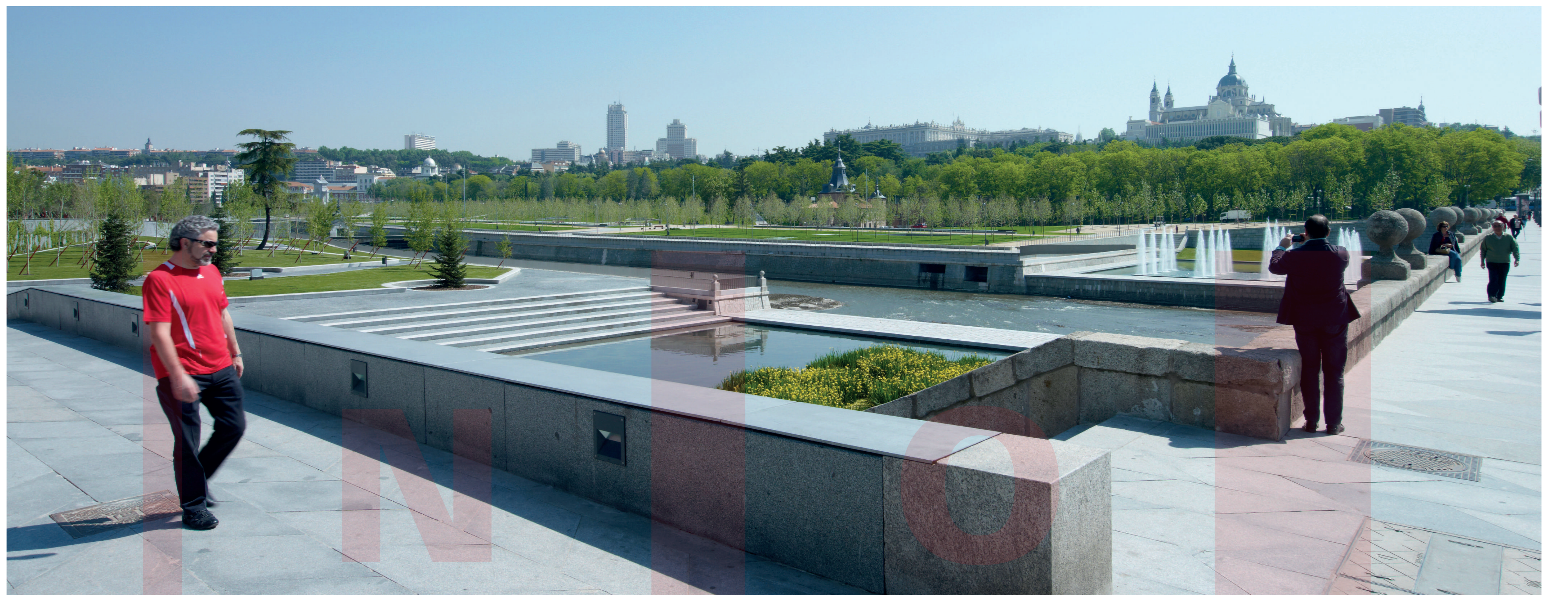
VEŘEJNÝ PROSTOR KOLEM ŘEKY PUBLIC SPACE AROUND THE RIVER