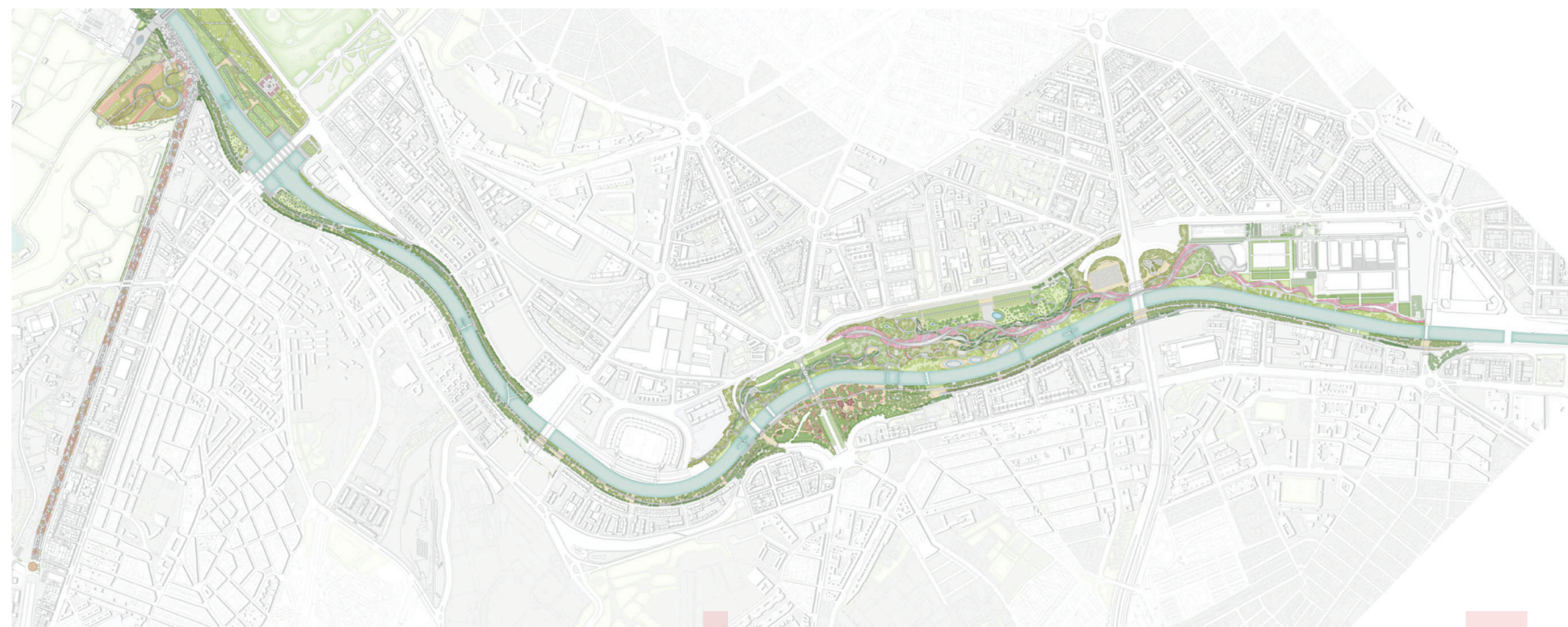
SITUACE SITE PLAN