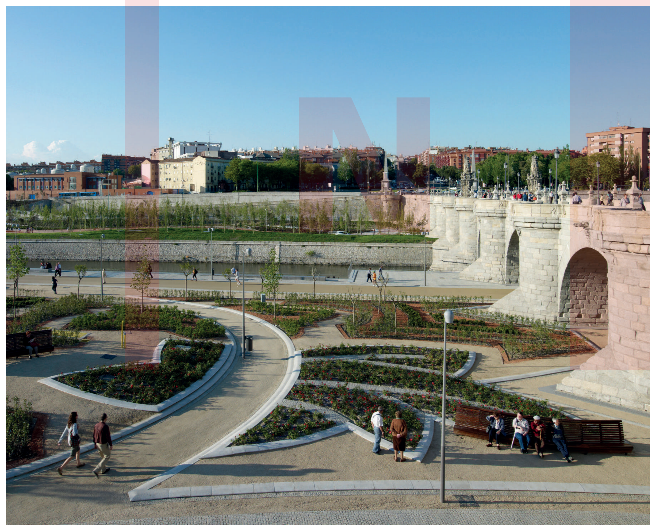
PARK POD HISTORICKÝM MOSTEM PARK UNDER THE HISTORIC BRIDGE