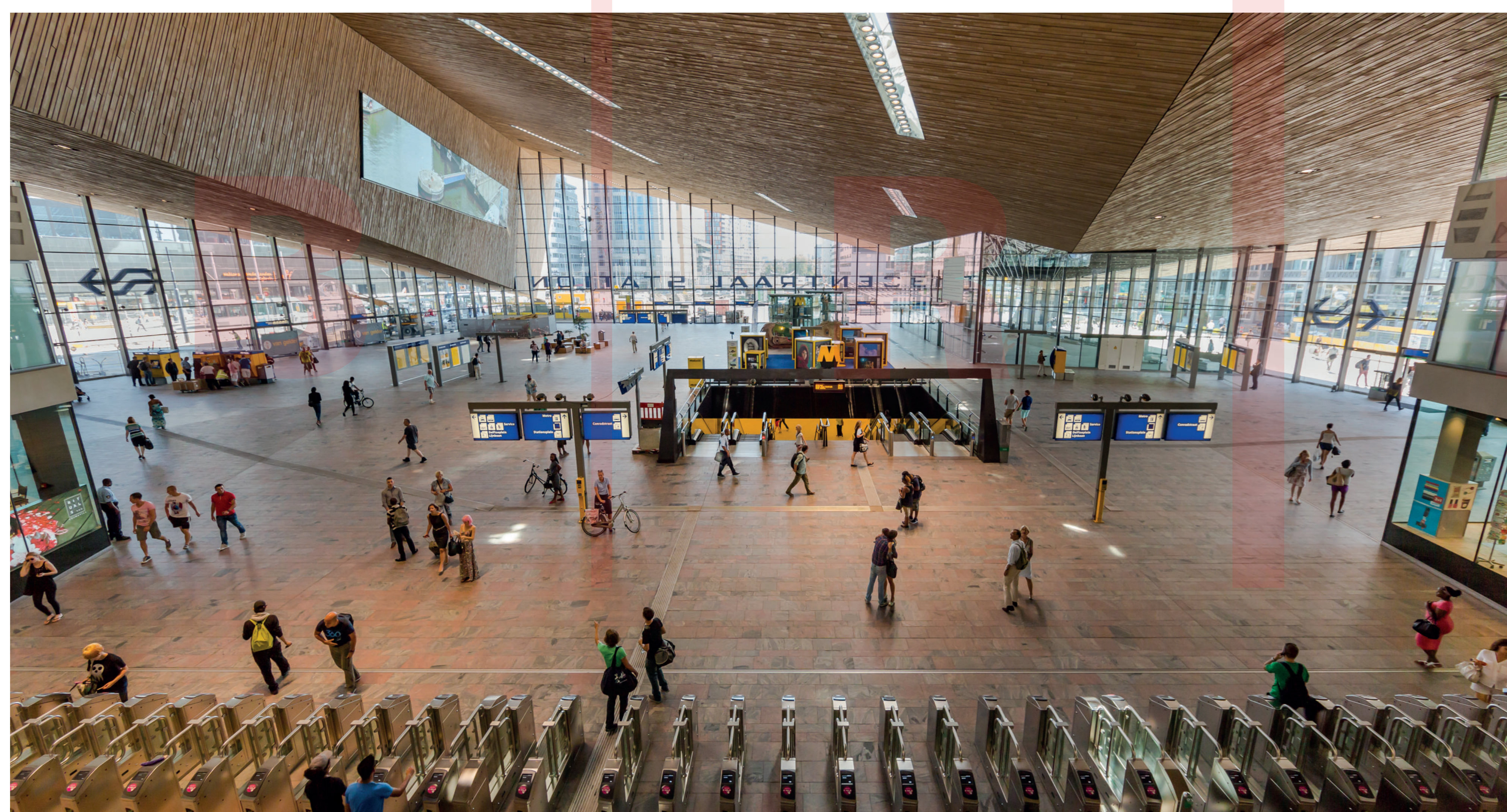
VSTUPNÍ HALA ENTRANCE HALL