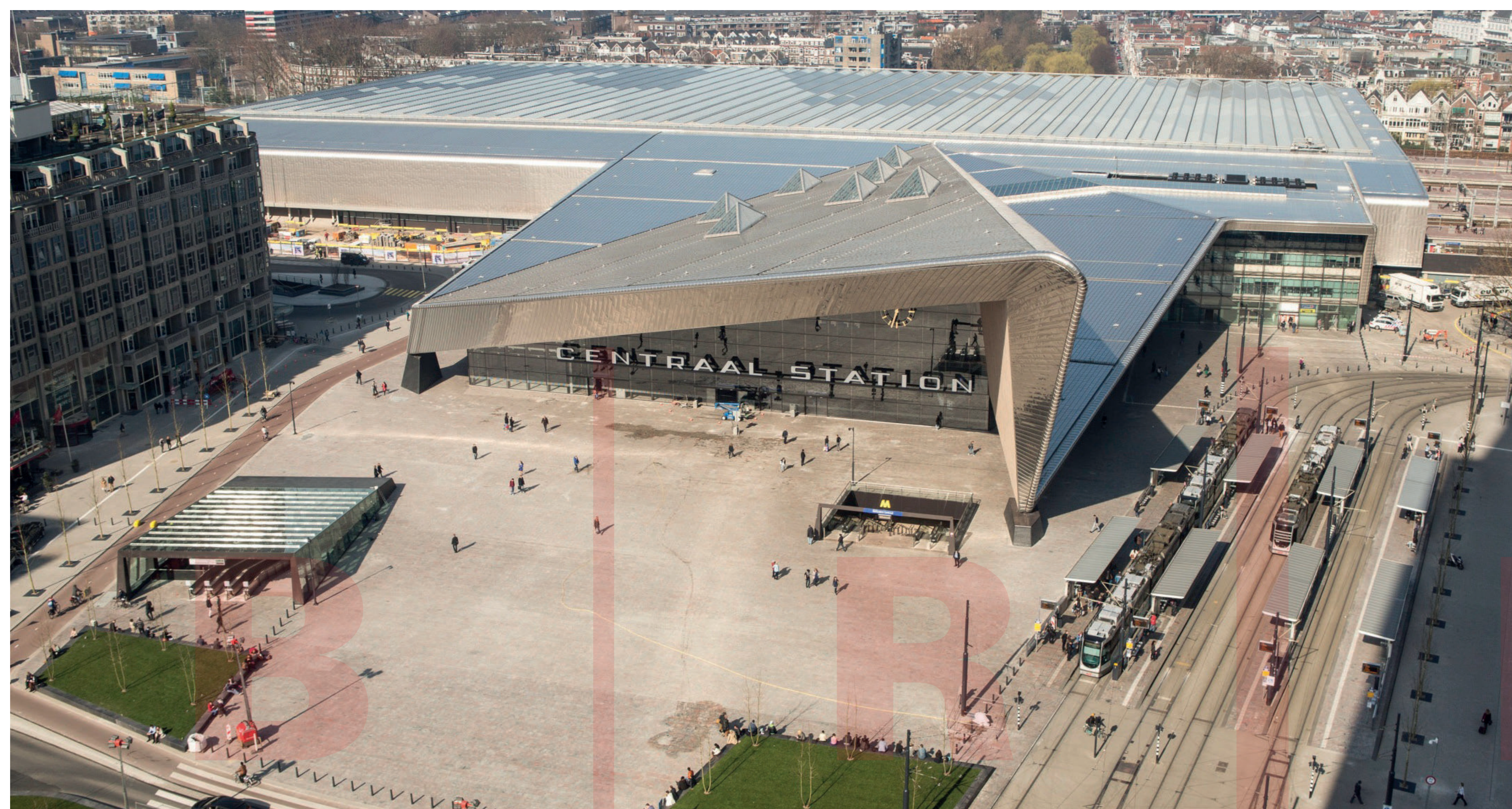
LETECKÝ SNÍMEK AN AERIAL PHOTO