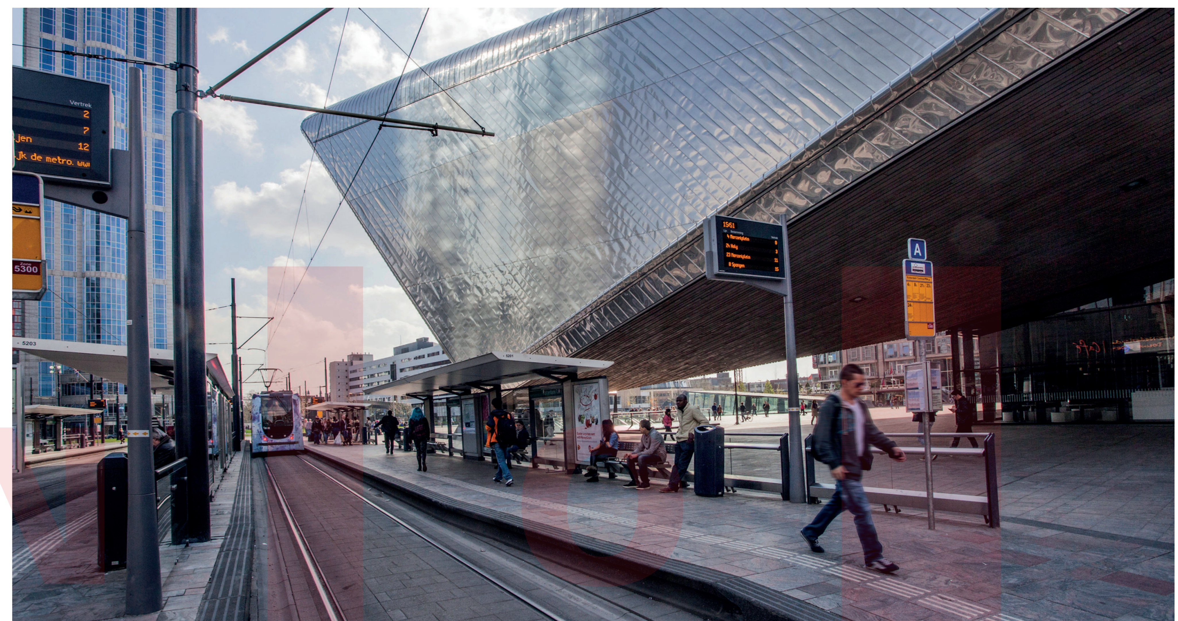
ZASTÁVKA MHD PUBLIC TRANSPORT STOP