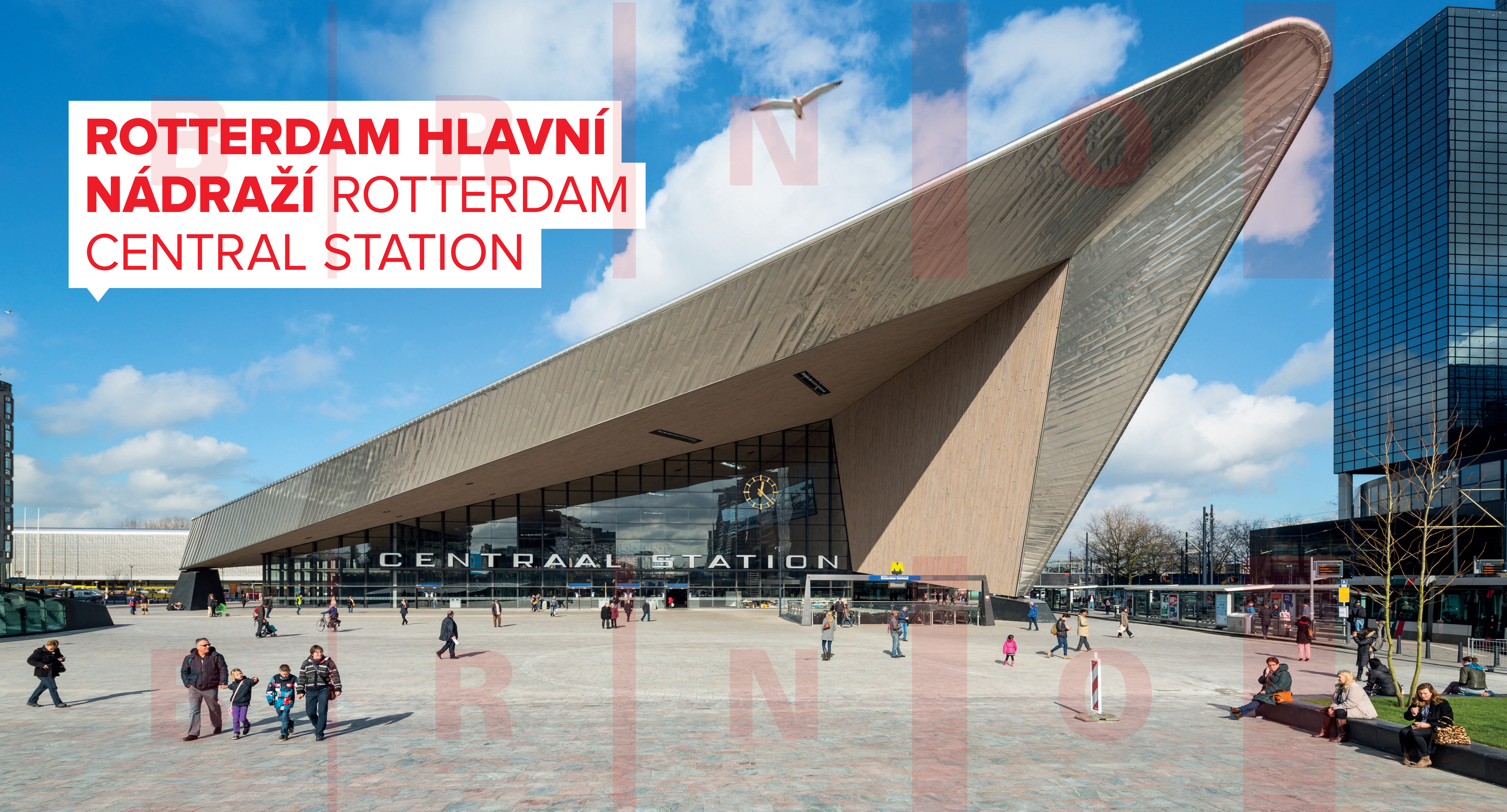
ROTTERDAM HLAVNÍ NÁDRAŽÍ, 2003–2014, BENTHEM CROUWEL ARCHITECTS A WEST 8 ROTTERDAM CENTRAL STATION, 2003–2014, BENTHEM CROUWEL ARCHITECTS AND WEST 8