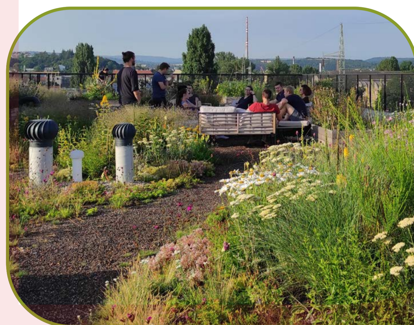
Po realizaci