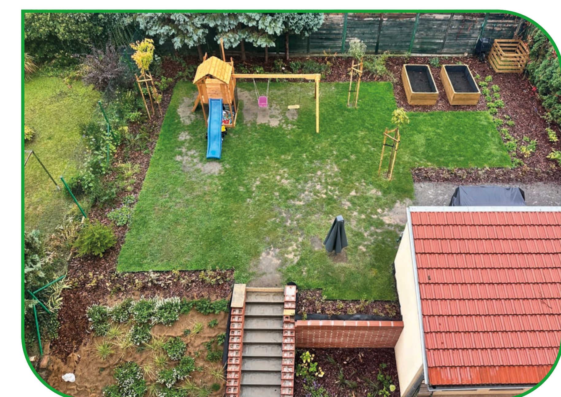
Fotografie vnitrobloku v Merhautově ulici před a po realizaci.