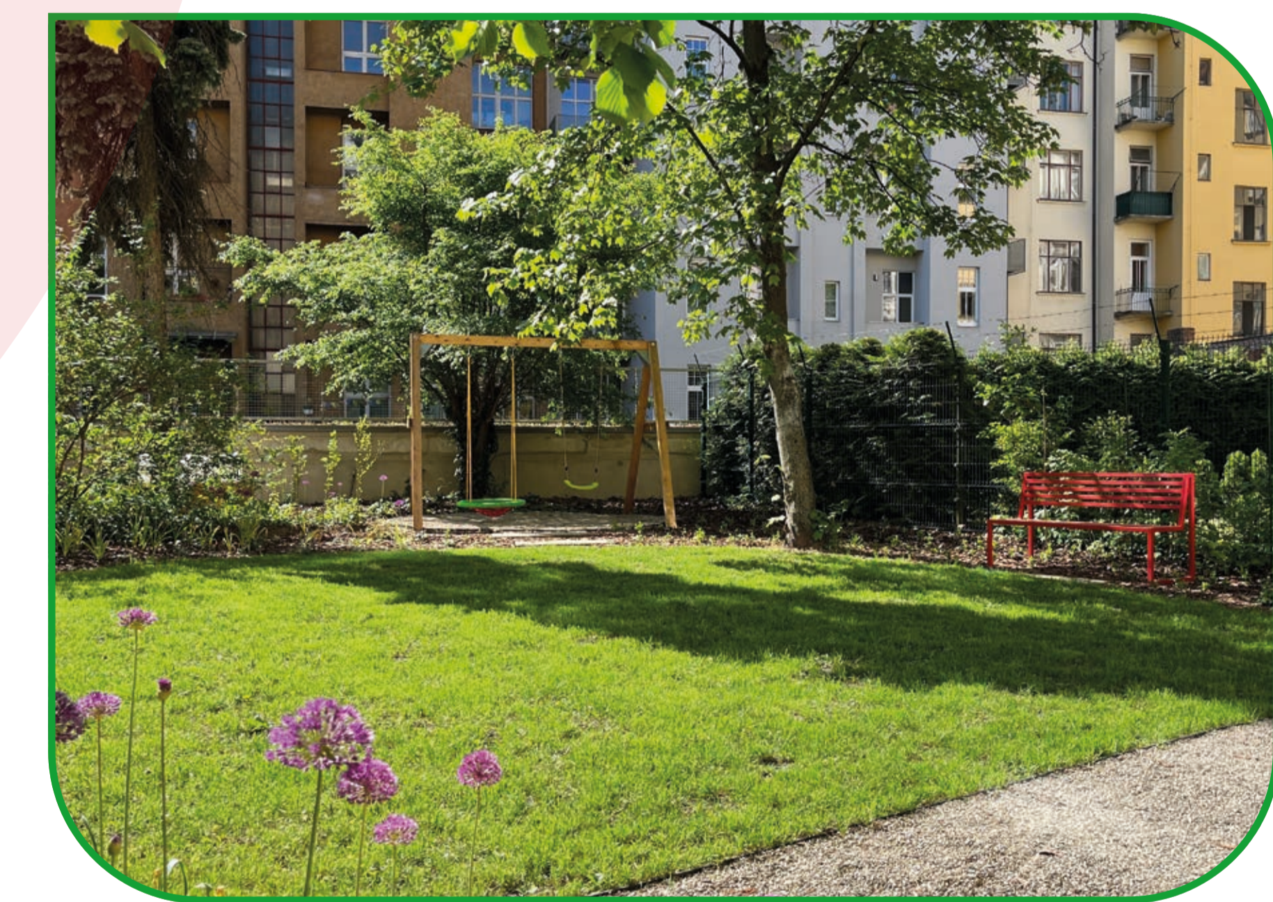
Fotografie vnitrobloku v Nerudově ulici před a po realizaci.