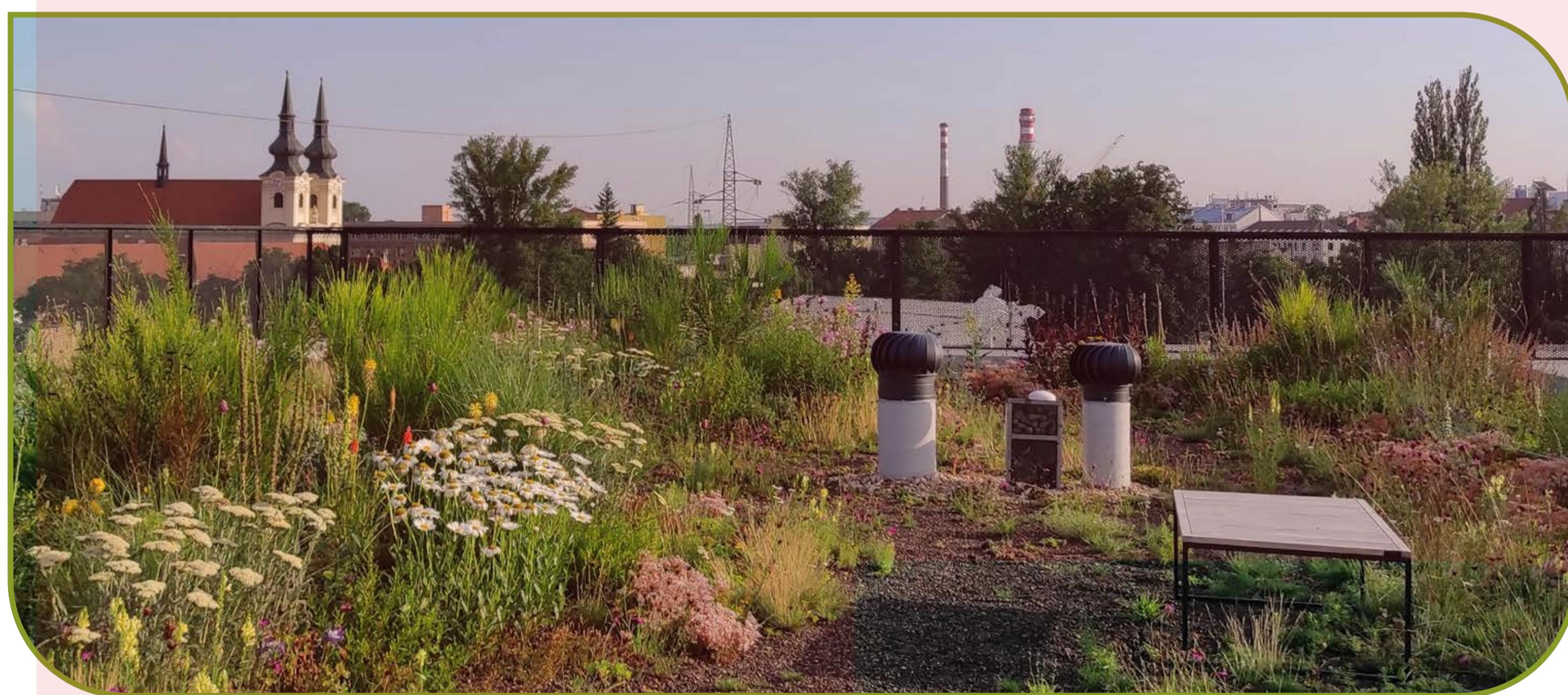
Po realizaci