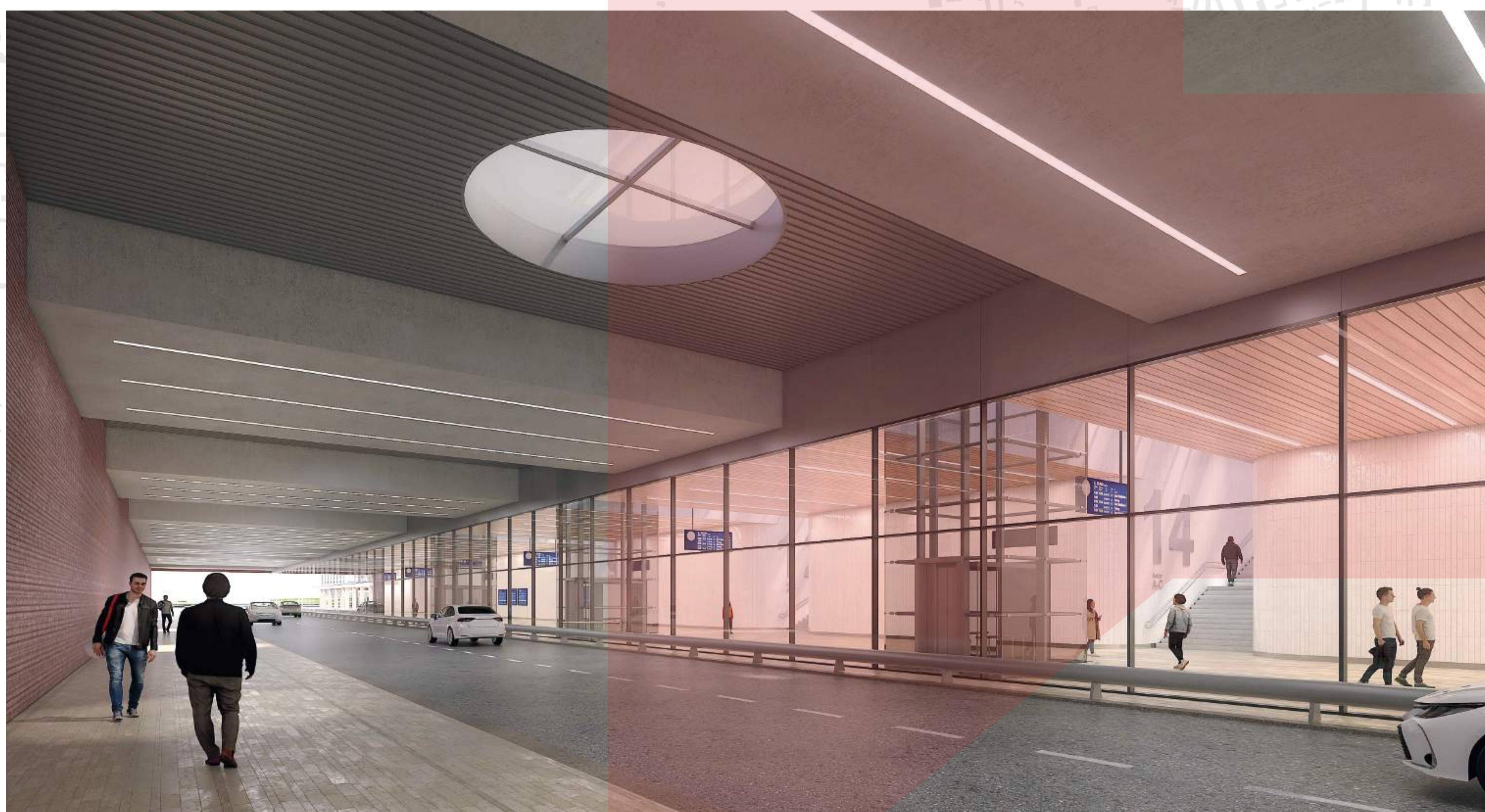
PODJEZD UHELNÁ A PASÁŽ S VEDLEJŠÍMI PŘÍSTUPY NA NÁSTUPIŠTĚ NOVÉHO HLAVNÍHO NÁDRAŽÍ BENTHEM CROUWEL ARCHITECTS