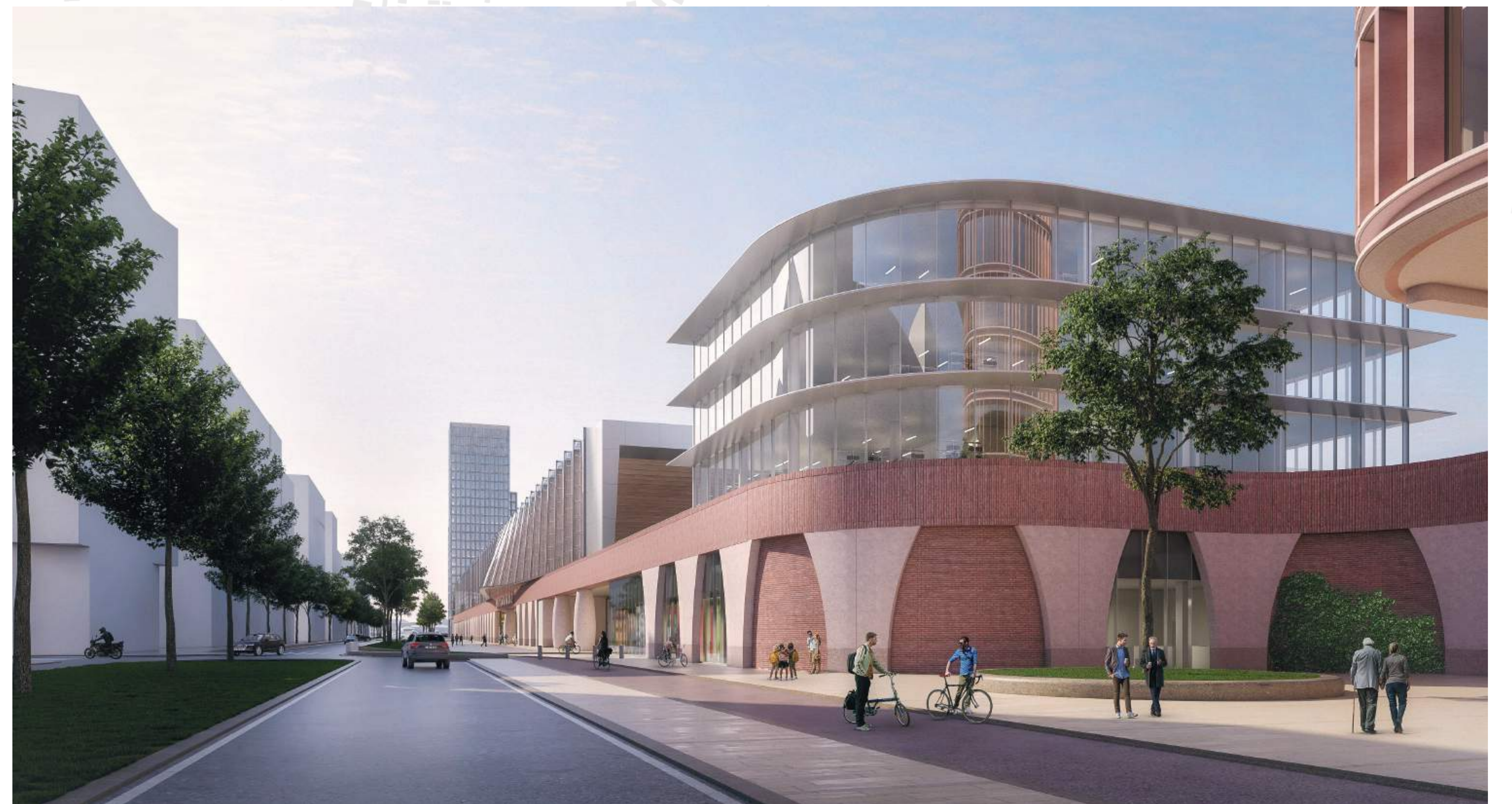
ULICE ZANÁDRAŽNÍ, V POPŘEDÍ BUDOVA DÍLEN SPRÁVY ŽELEZNIC S ÚSCHOVNOU KOL, V POZADÍ ADMINISTRATIVNÍ OBJEKTY BENTHEM CROUWEL ARCHITECTS