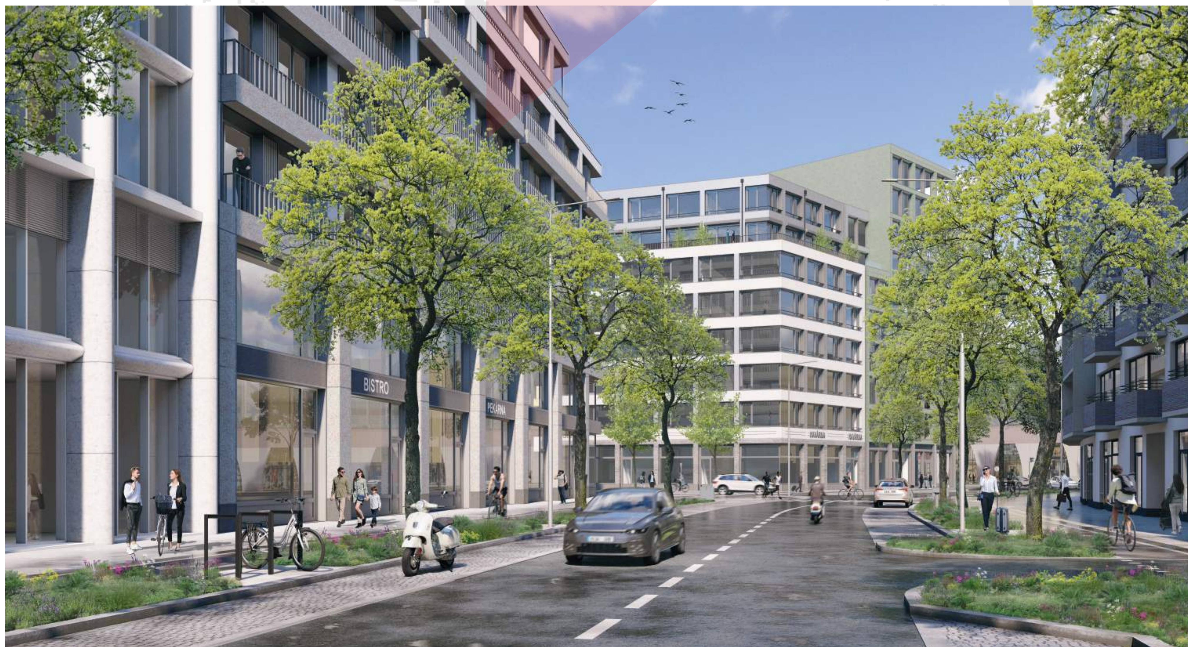
ULICE V ZANÁDRAŽÍ SE STROMOŘADÍM, PARKOVÁNÍM, CYKLOSTEZKAMI A ŠÍROKÝMI CHODNÍKY BRNĚNSKÉ KOMUNIKACE