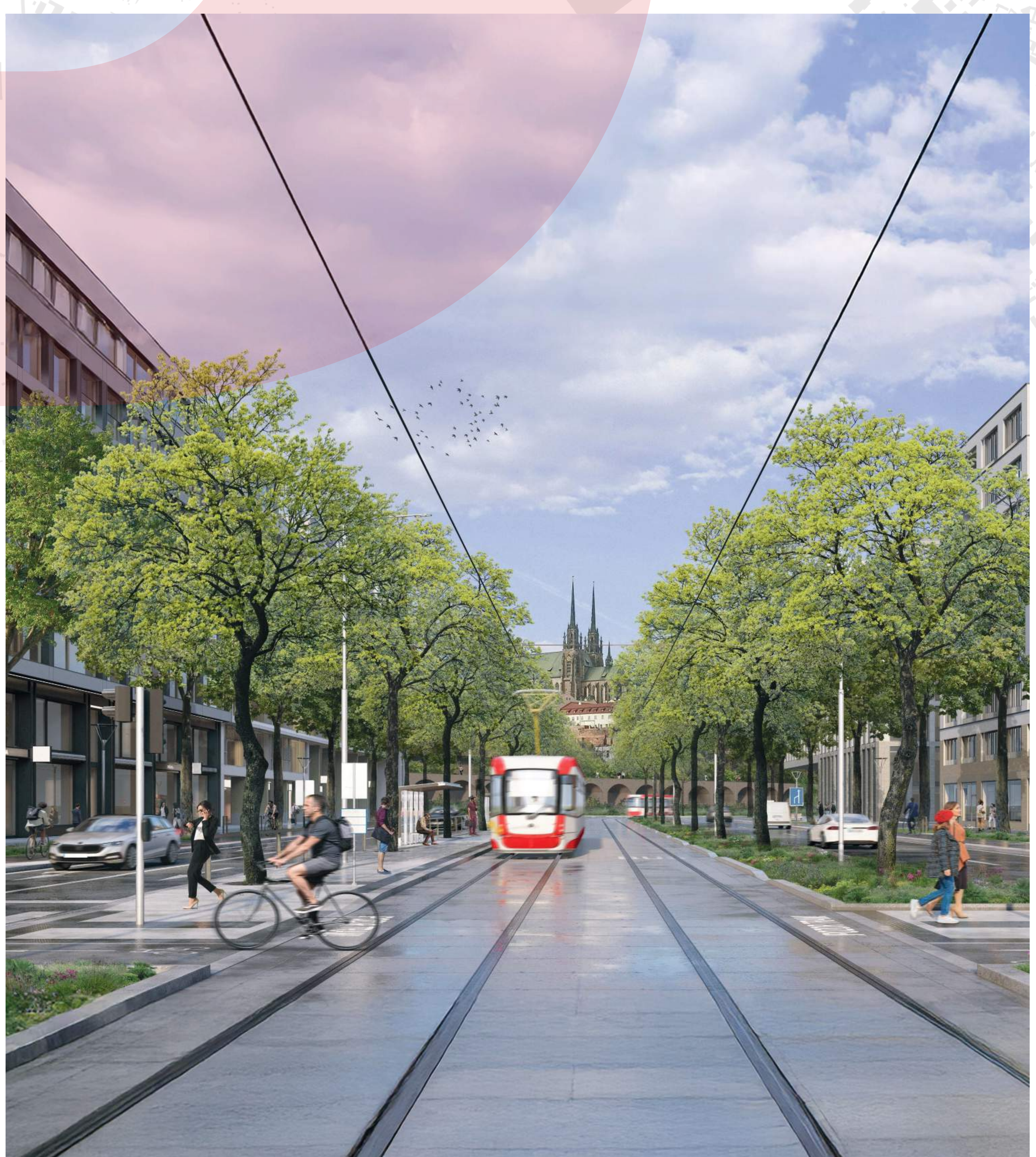
SEVERNÍ ČÁST BULVÁRU – ETAPA II – TRAMVAJE VEDENY STŘEDOVÝM PÁSEM BRNĚNSKÉ KOMUNIKACE