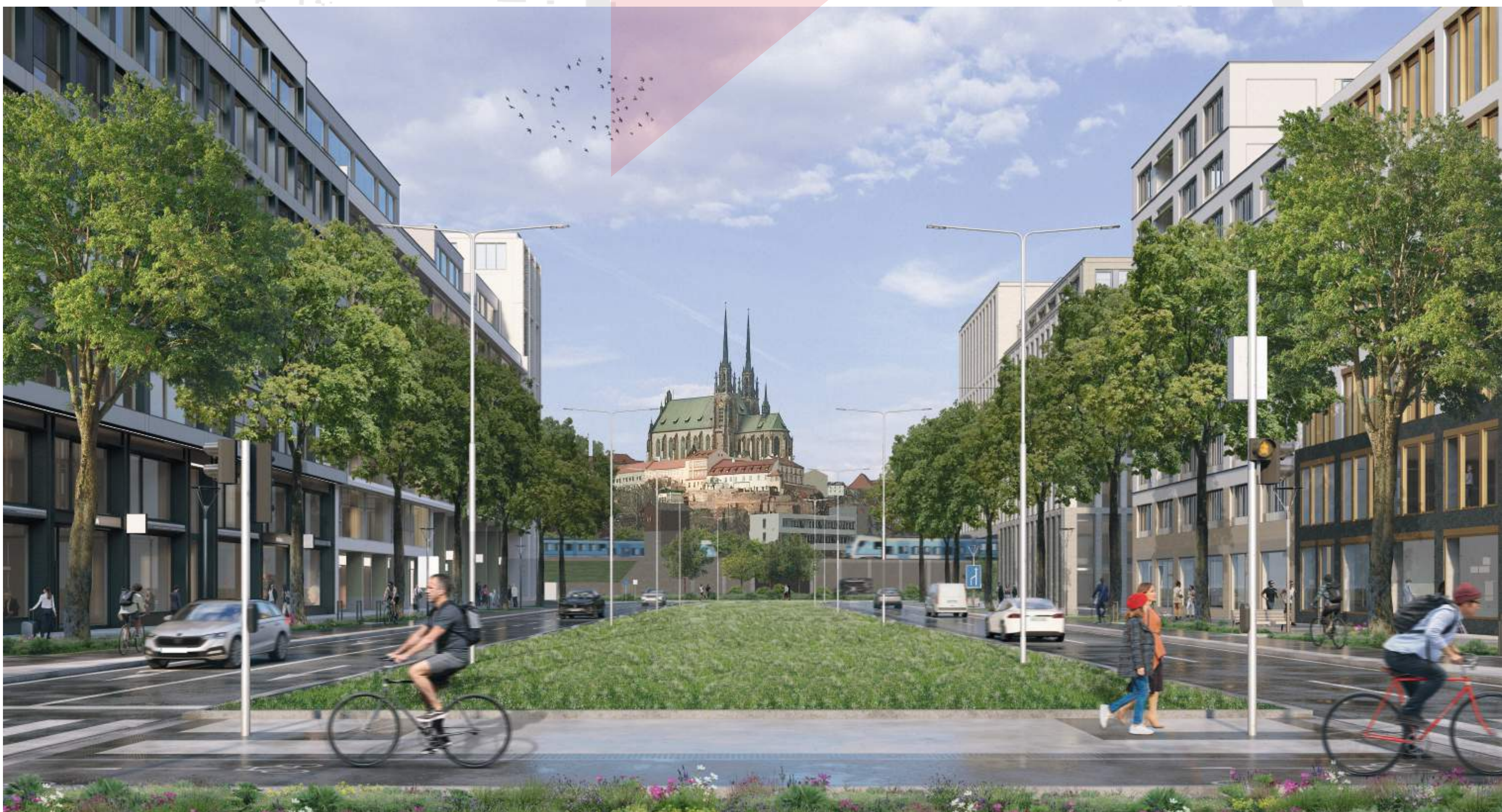
SEVERNÍ ČÁST BULVÁRU – ETAPA I – DOČASNÁ ZELENÁ PLOCHA DO DOBY VYBUDOVÁNÍ TRAMVAJOVÝCH TRATÍ BRNĚNSKÉ KOMUNIKACE