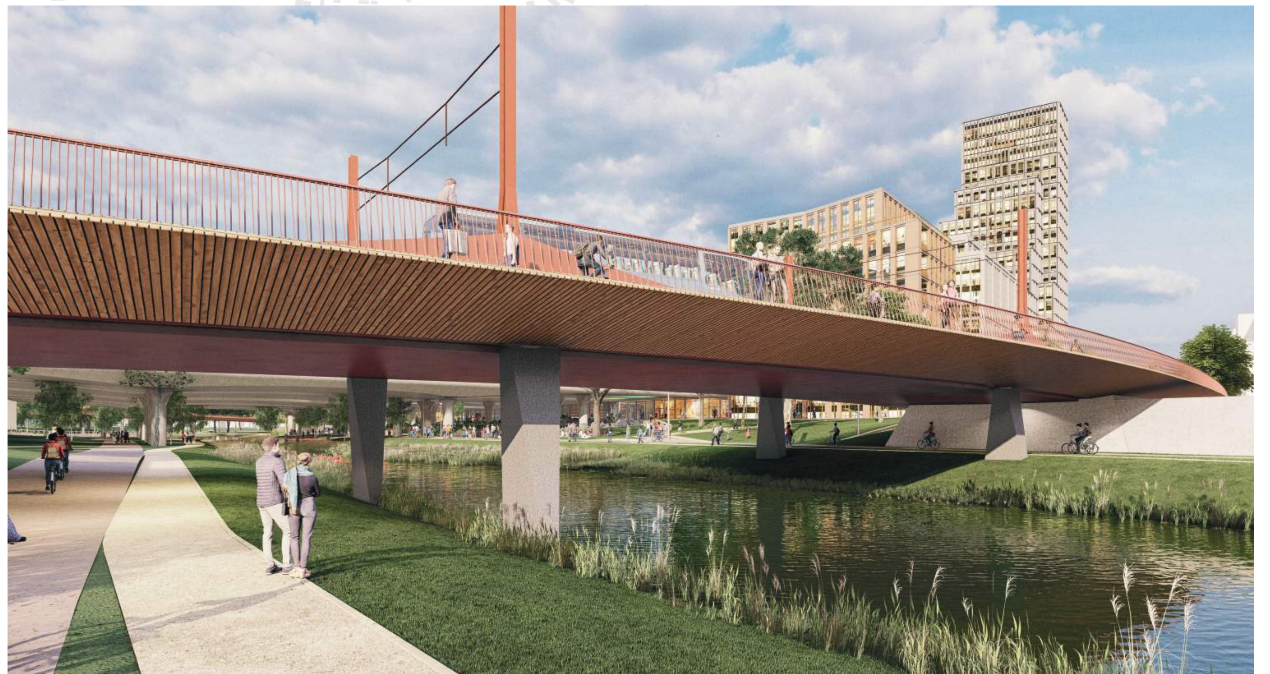
PROTIPOVODNÝ PARK S AUTOMOBILOVÝM MOSTEM A ADMINISTRATIVNÍMI BUDOVOU V ZANÁDRAŽÍ WEST 8