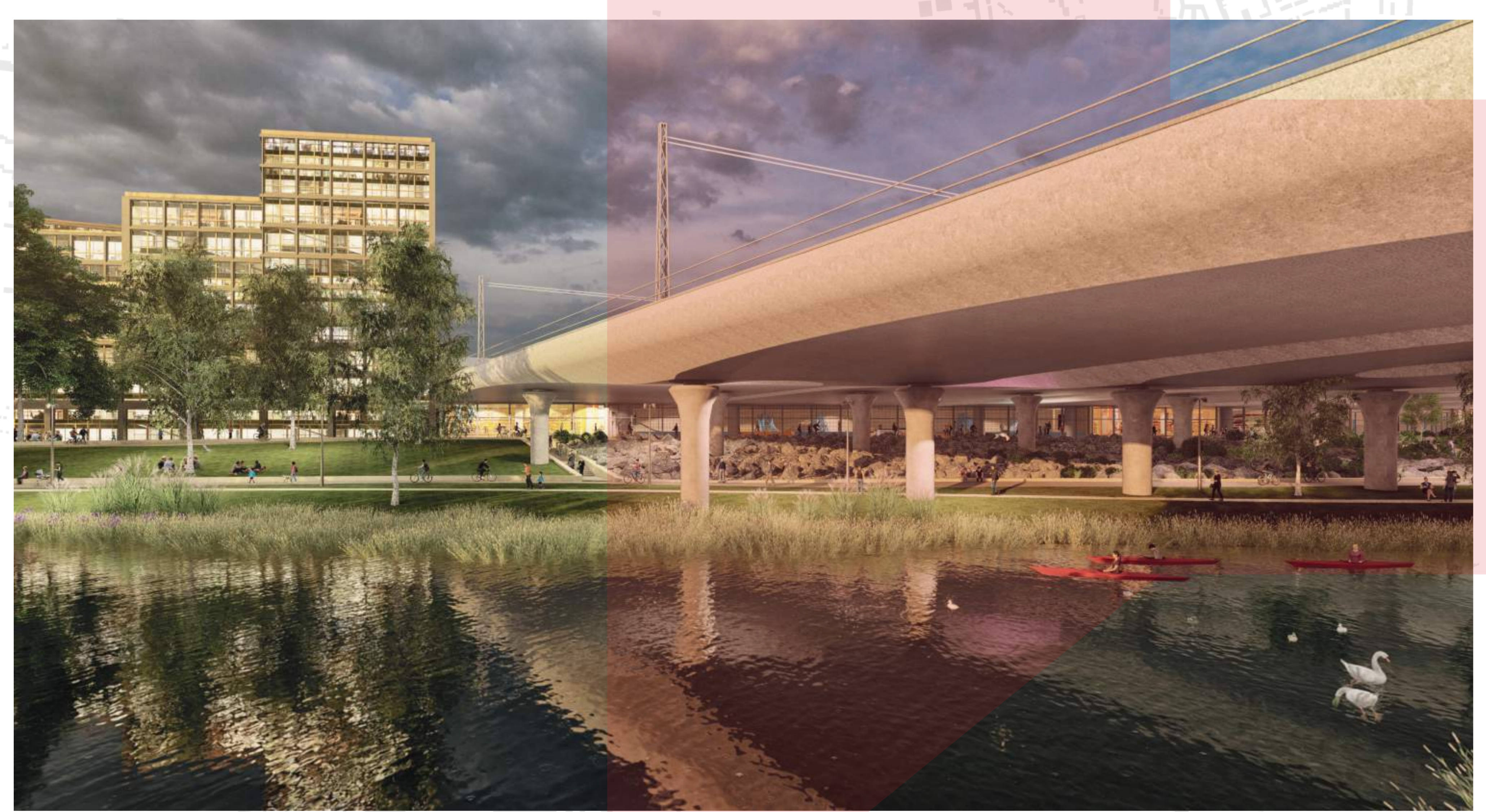
NÁBŘEŽNÍ PARK S BUDOVOU STUDENTSKÉHO BYDLENÍ A AKTIVITAMI POD ŽELEZNIČNÍM MOSTEM WEST 8