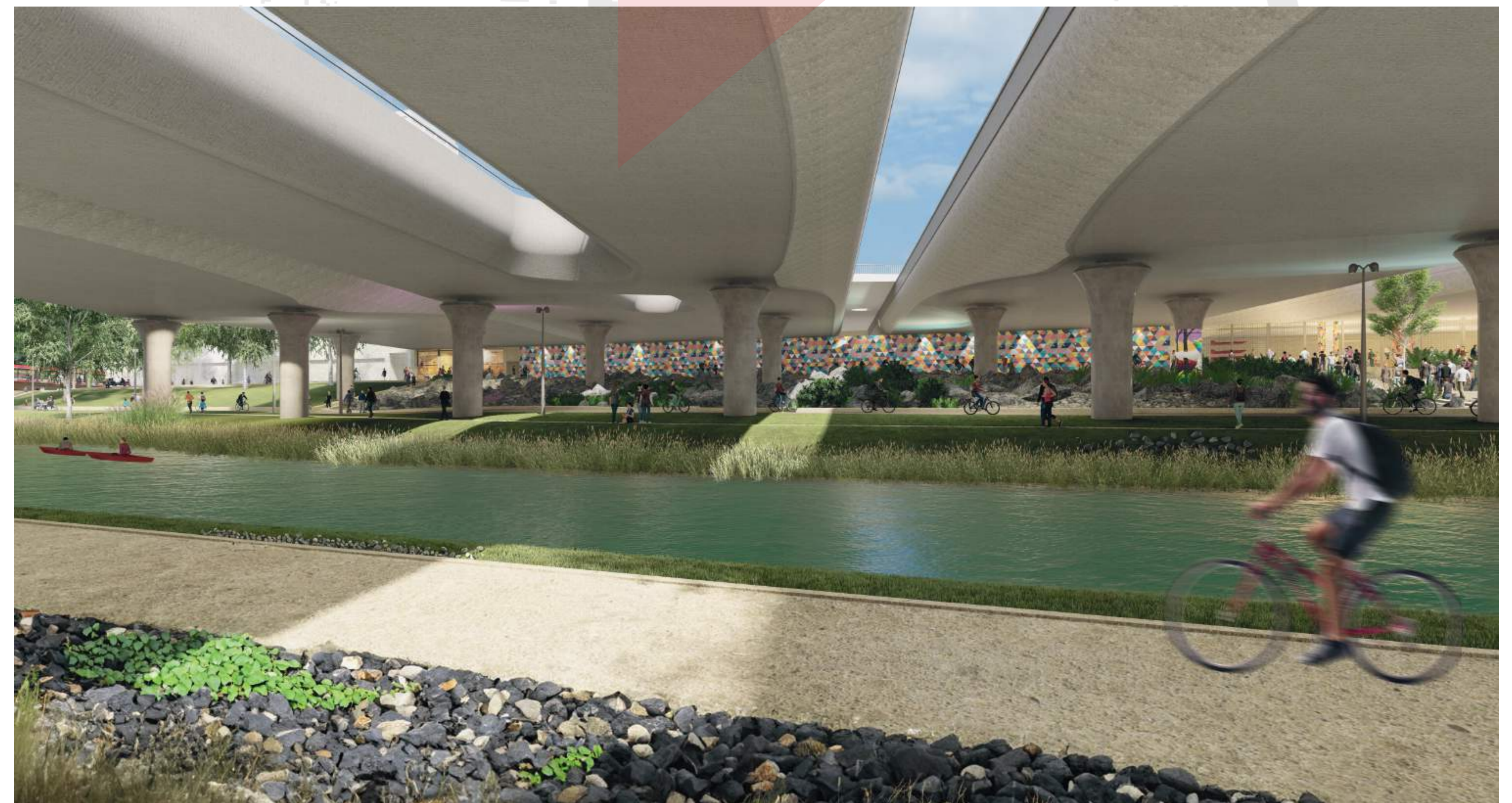
NÁBŘEŽNÍ PARK OSVĚTLEN PROSTUPY KONSTRUKCÍ ŽELEZNIČNÍHO MOSTU WEST 8