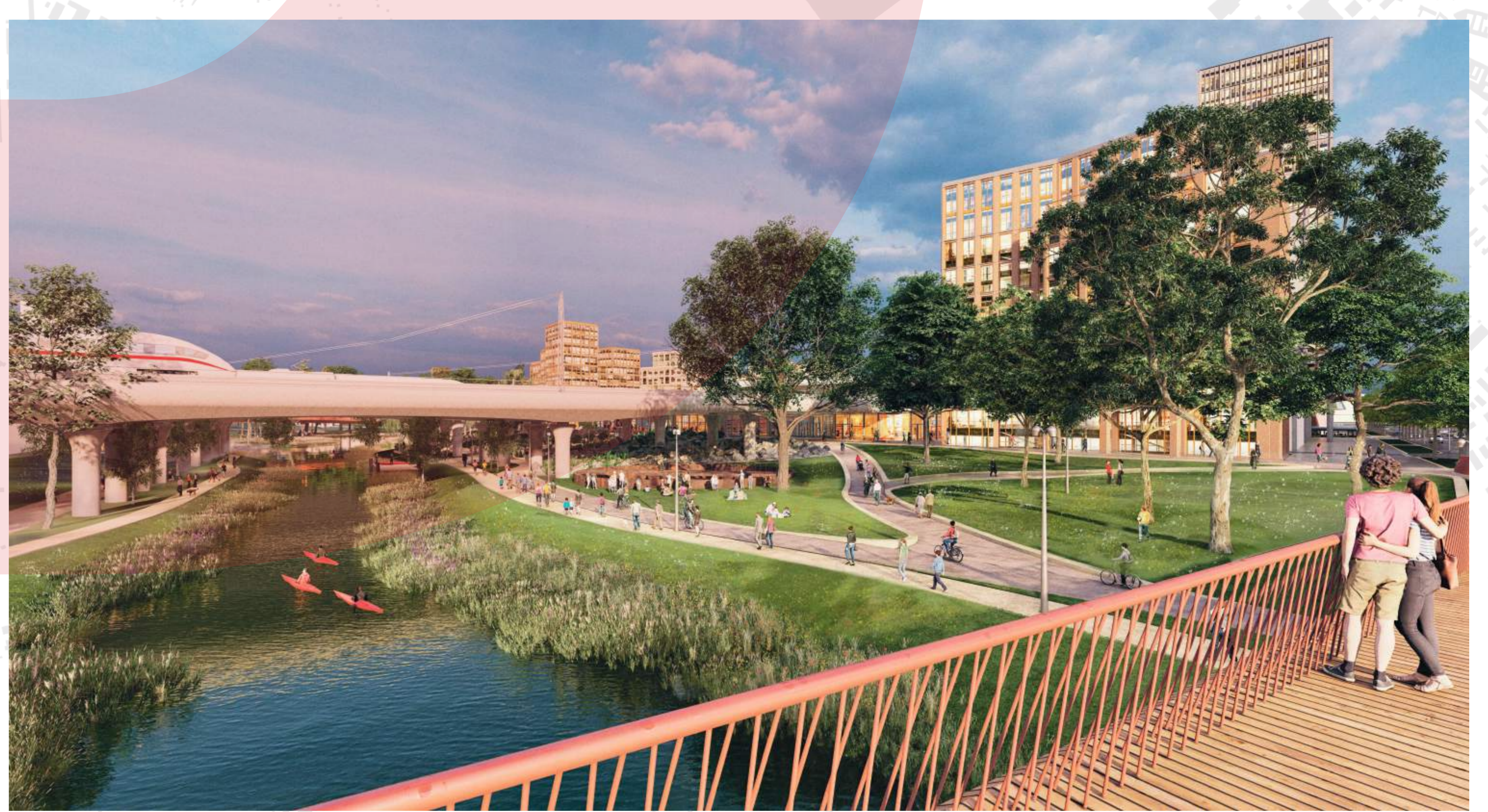
PROTIPOVODNÝ PARK SE ZAKOMPOVANOU PŮVODNÍ KOLEJOVOU TOČNOU WEST 8