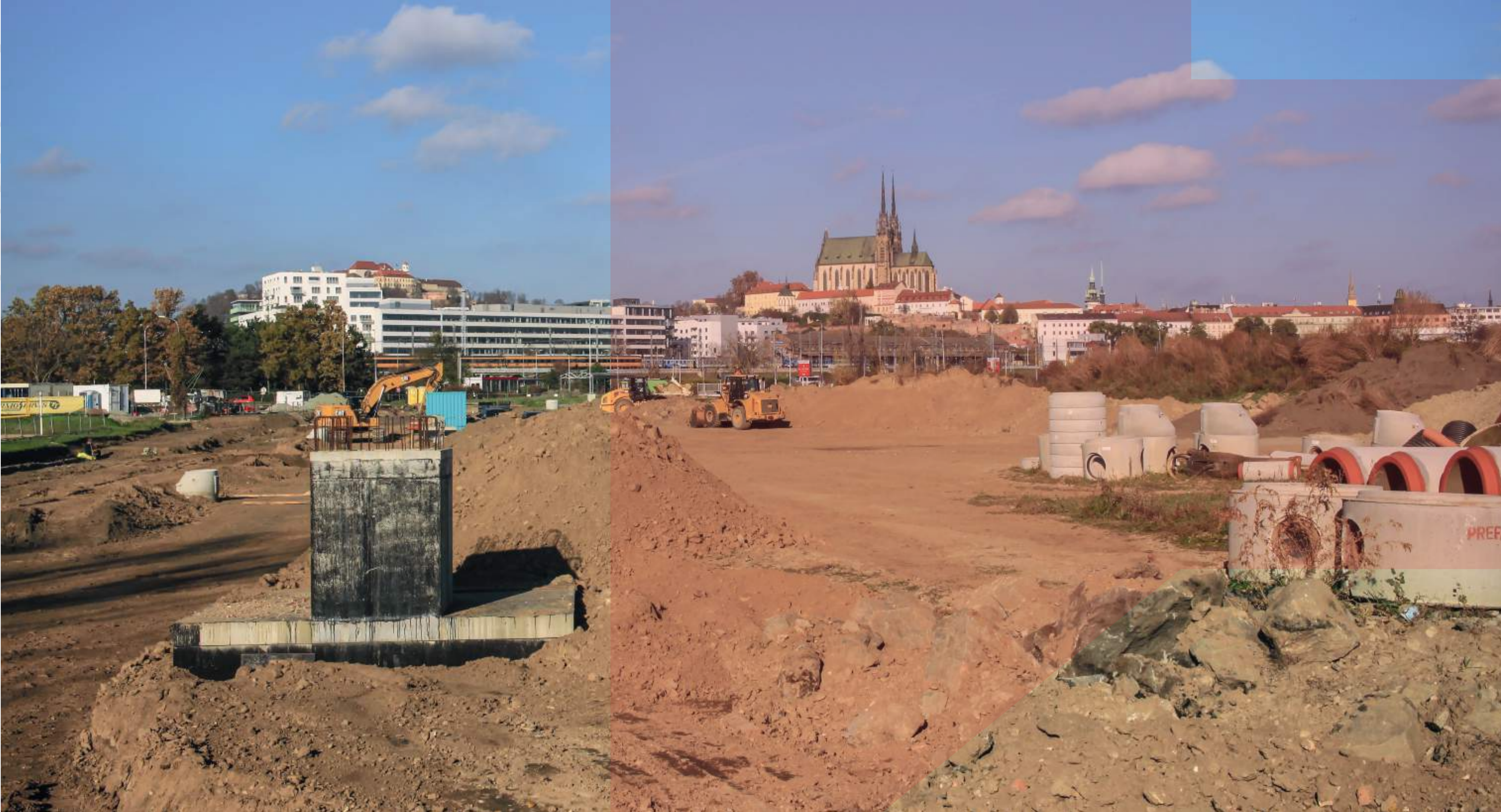
VÝSTAVBA PRODLOUŽENÉ ULICE ÚHELNÁ