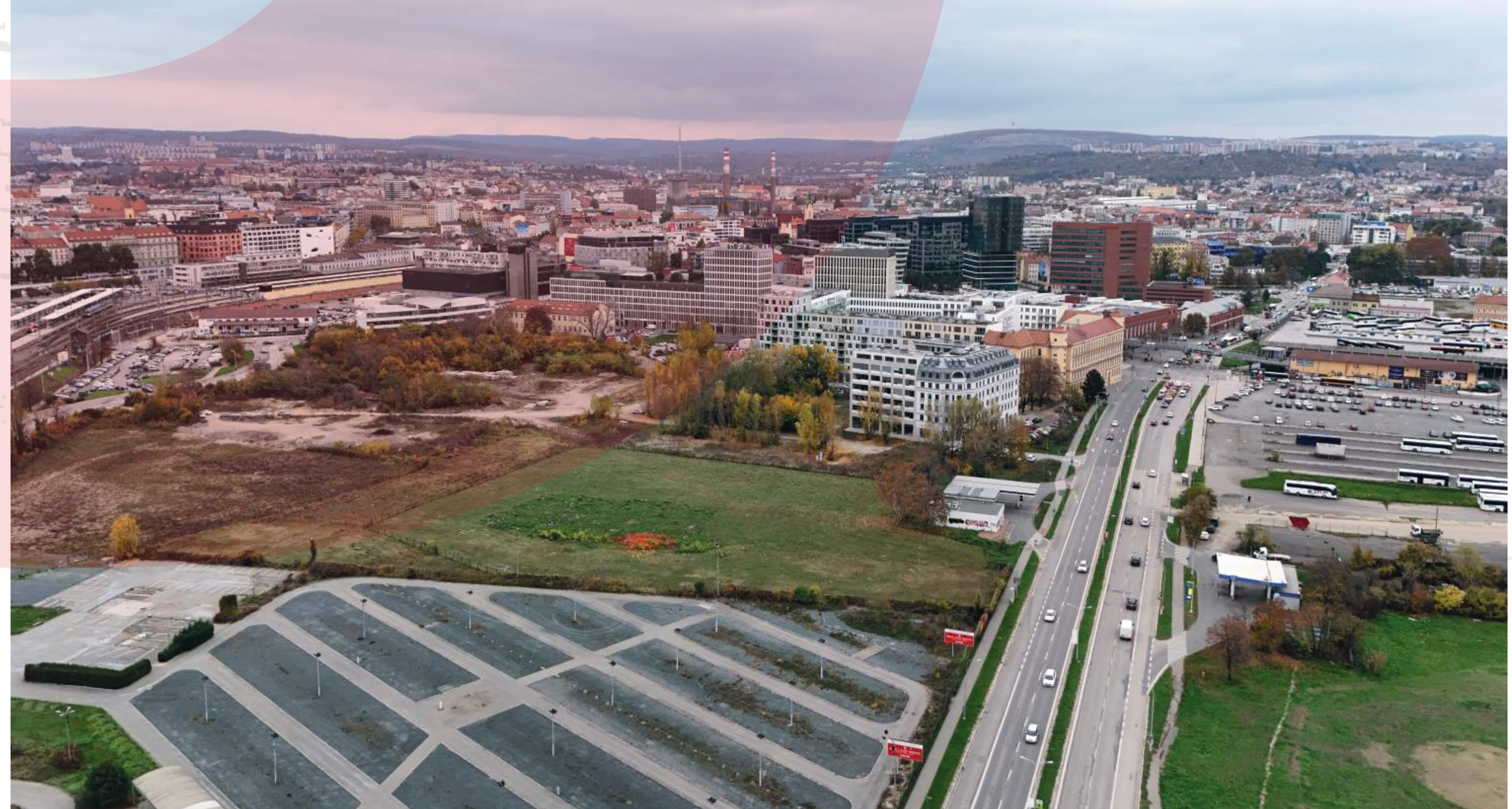
POHLED NA ÚZEMÍ MEZI ULICEMI OPUŠTĚNÁ A UZKÁ, NA KTERÉM VZNIKNOU NOVÉ MĚSTSKÉ BLOKY BRNĚNSKÉ KOMUNIKACE