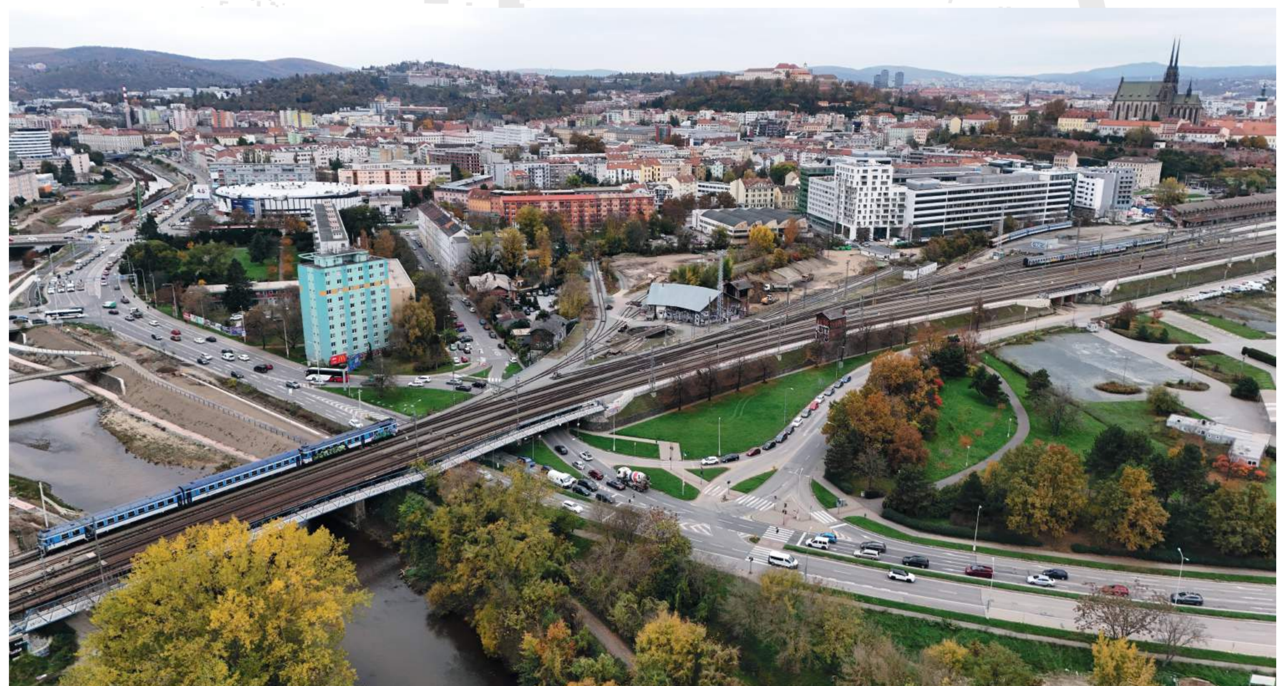
PO DOKONČENÍ NOVÉHO HLAVNÍHO NÁDRAŽÍ BUDE STÁVAJÍCÍ ŽELEZNIČNÍ TRÁŤ ODSTRANĚNA A NAHRAZENA LINIOVÝM PARKEM BRNĚNSKÉ KOMUNIKACE