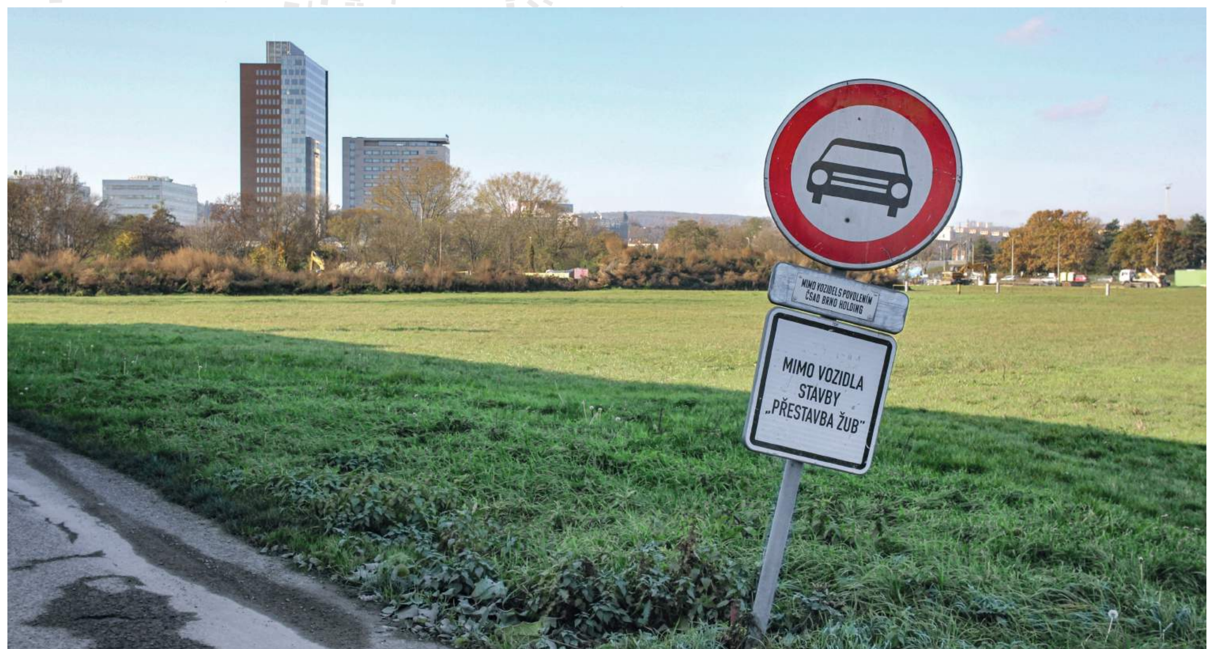
POHLED SMĚREM K NÁBŘEŽÍ SVRATKY, BUDOUCÍ PŘEDNÁDRAŽNÍ PROSTOR