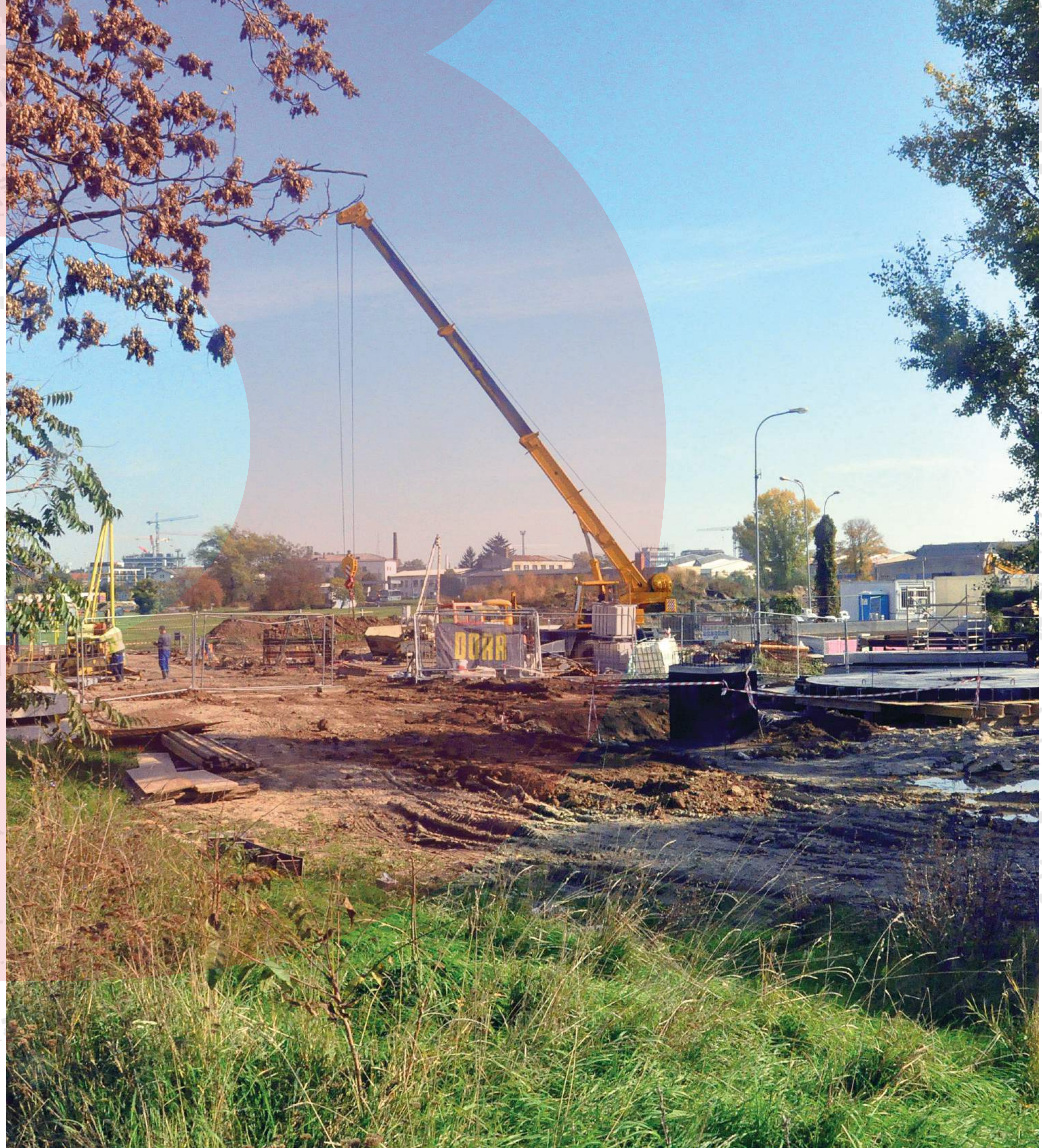
REKONSTRUKCE ČERPAČÍ STANICE ODPADNÍCH VOD PŘI ULICI OPUŠTENÁ