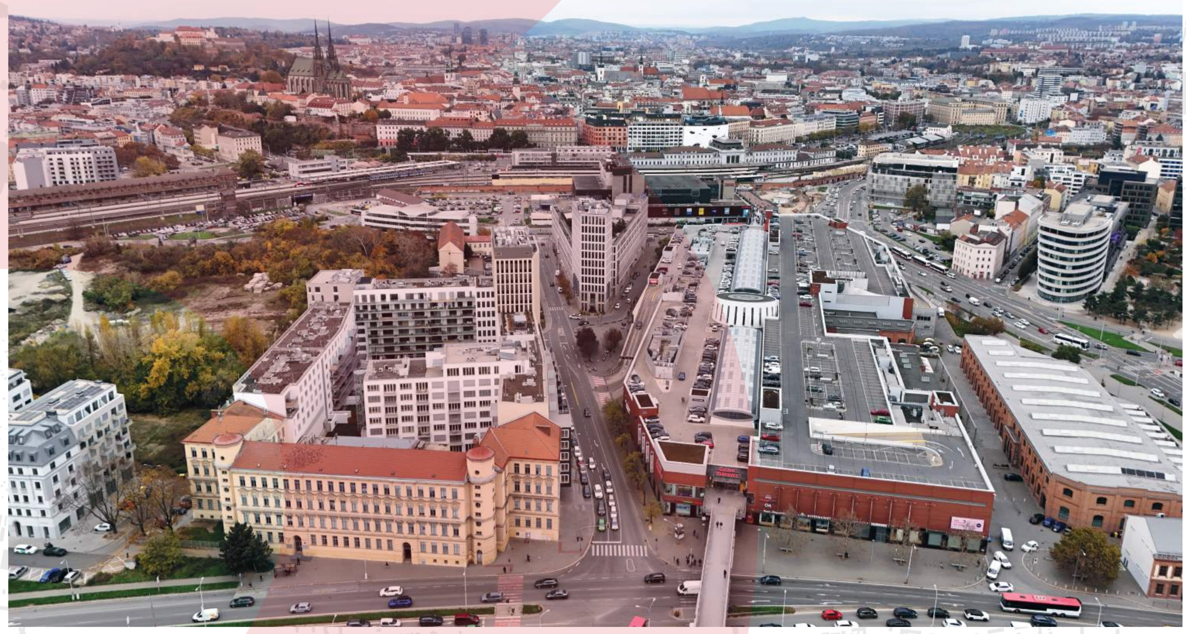
MĚSTSKÉ BLOKY PŘI ULICI TRNITÁ BRNĚNSKÉ KOMUNIKACE