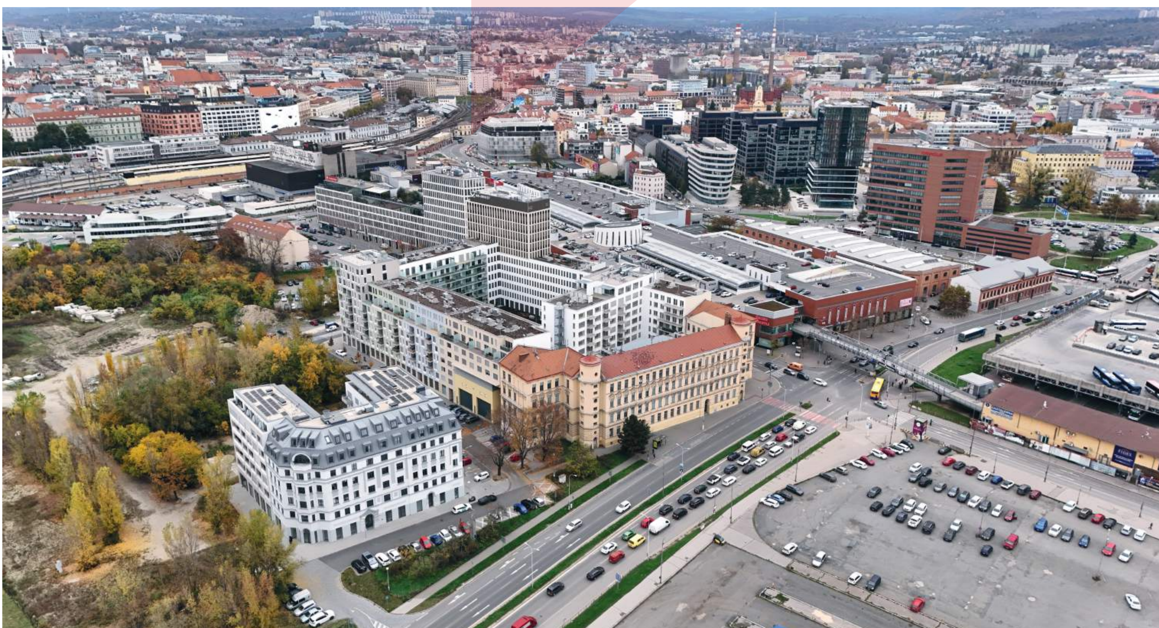
POHLED NA PRVNÍ DOKONČENÉ BLOKY NOVÉ ČTVRTI TRNITÁ S PŘEVÁŽNĚ REZIDENČNÍ FUNKCÍ BRNĚNSKÉ KOMUNIKACE