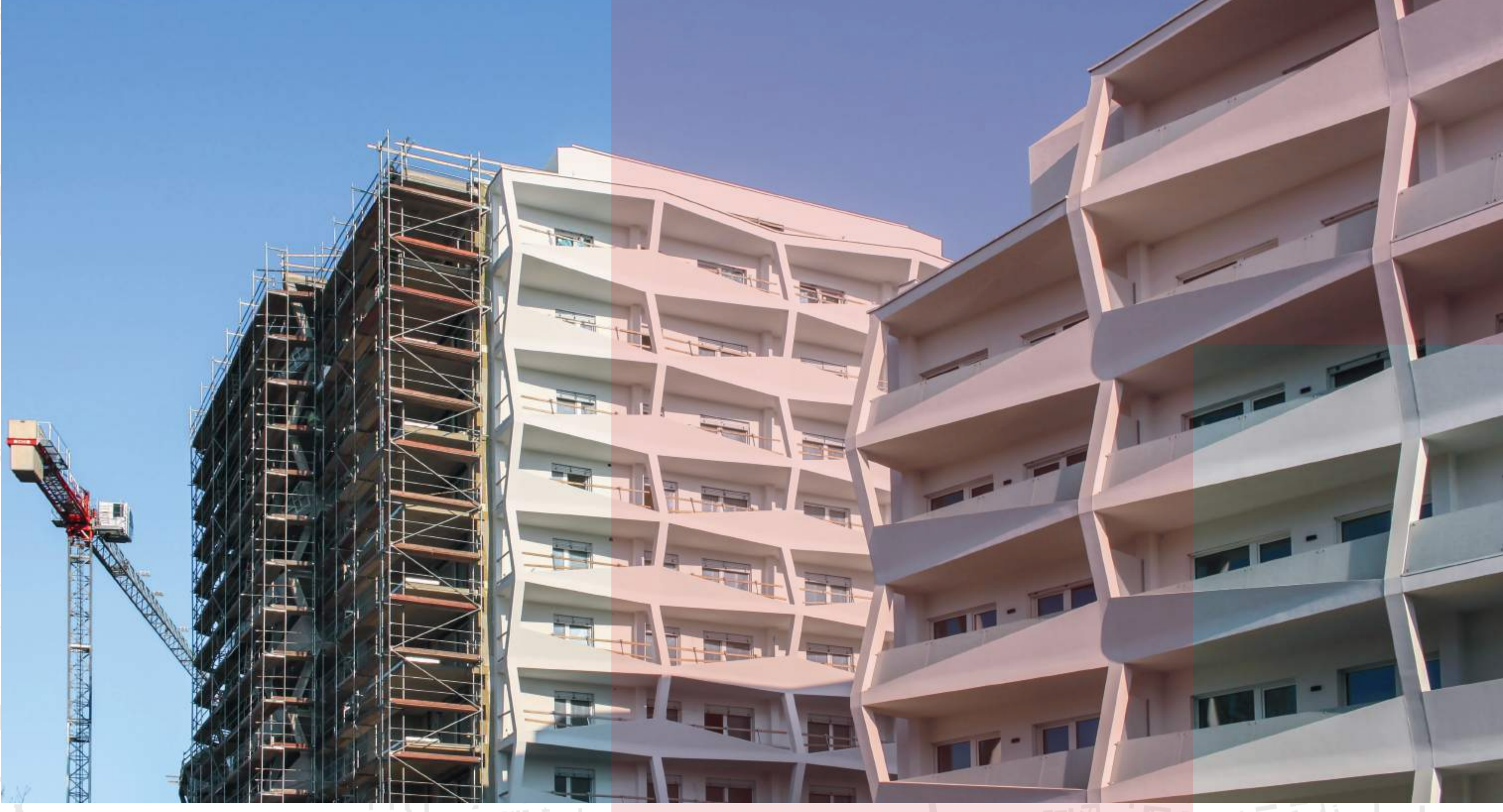
NOVÁ VÝSTAVBA V PROSTORU ZANÁDRAŽÍ