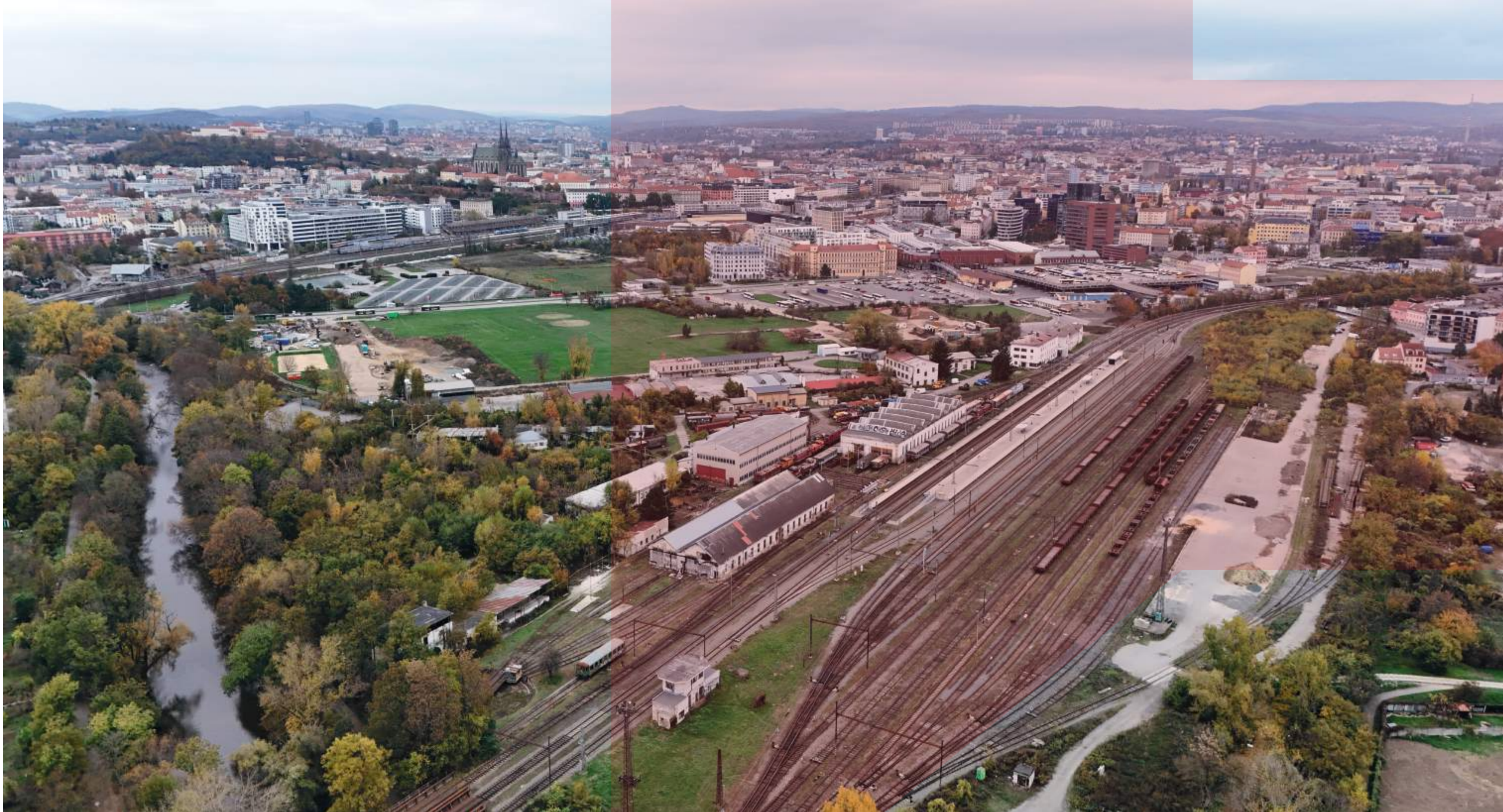
KOLEJISŤE U DOLNÍHO NÁDRAŽÍ NA ROSICKÉ NAHRADÍ NOVÁ PODOBA HLAVNÍHO NÁDRAŽÍ BRNĚNSKÉ KOMUNIKACE