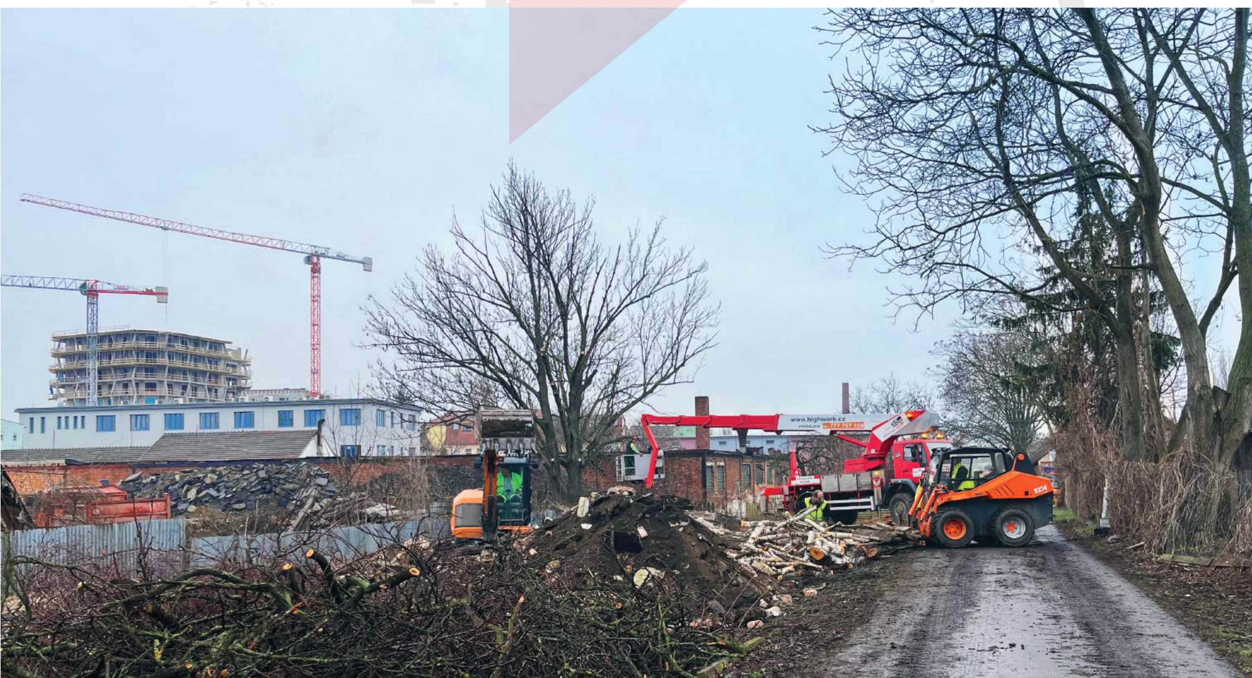
PŘÍPRAVA ÚZEMÍ PRO VÝSTAVBU PRODLOUŽENÍ ULICE KALOVÁ