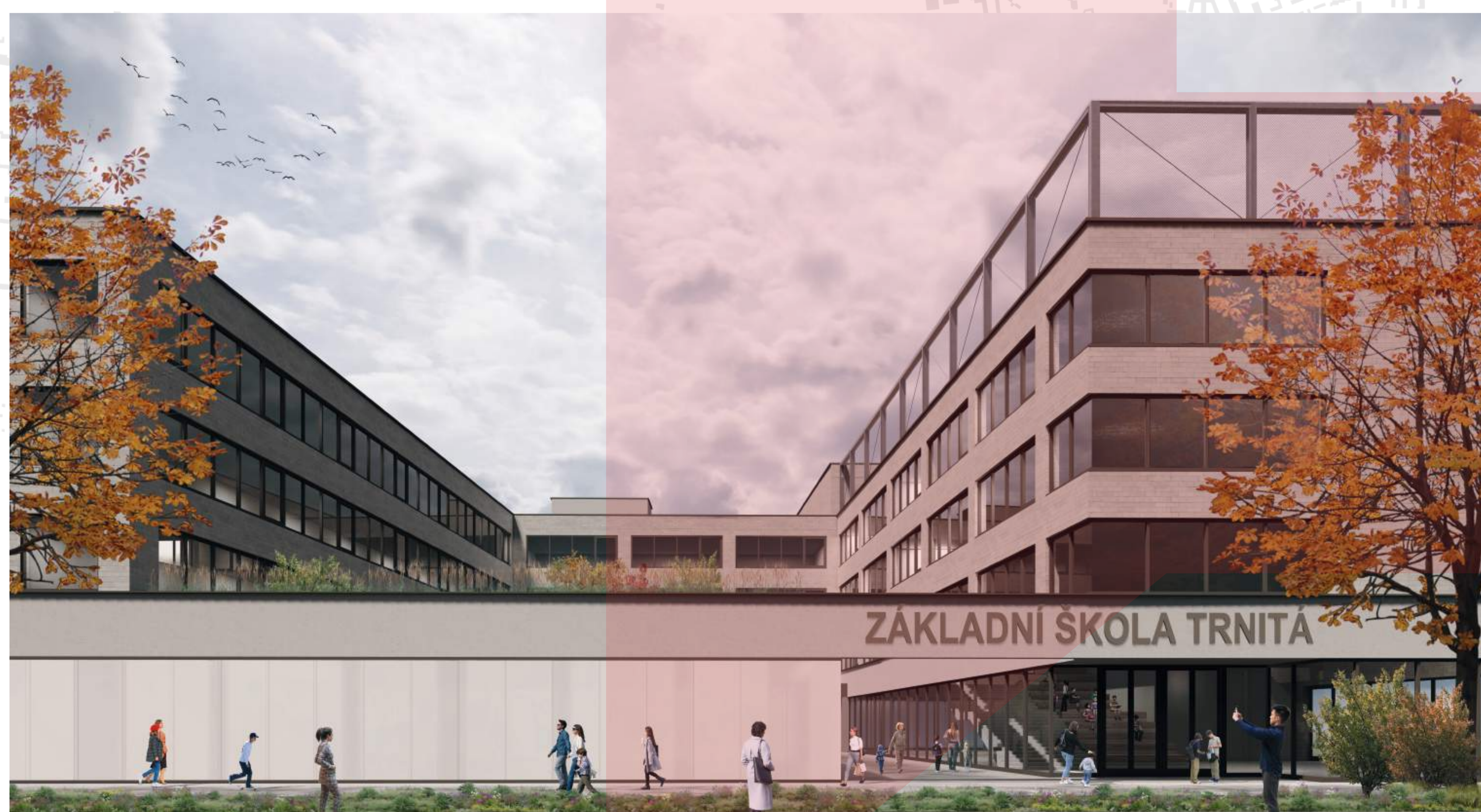
ZÁKLADNÍ A MATERSKÁ ŠKOLA V NOVÉ ČTVRTI JE UMÍSTĚNA U ZKLIDNĚNÉ ULICE BEZ AUTOMOBILOVÉ DOPRAVY BRNĚNSKÉ KOMUNIKACE

jádro komunikace recepce přestávky klientská hala solenní jednotky kanceláře sklady technické zázemí koleje parkování