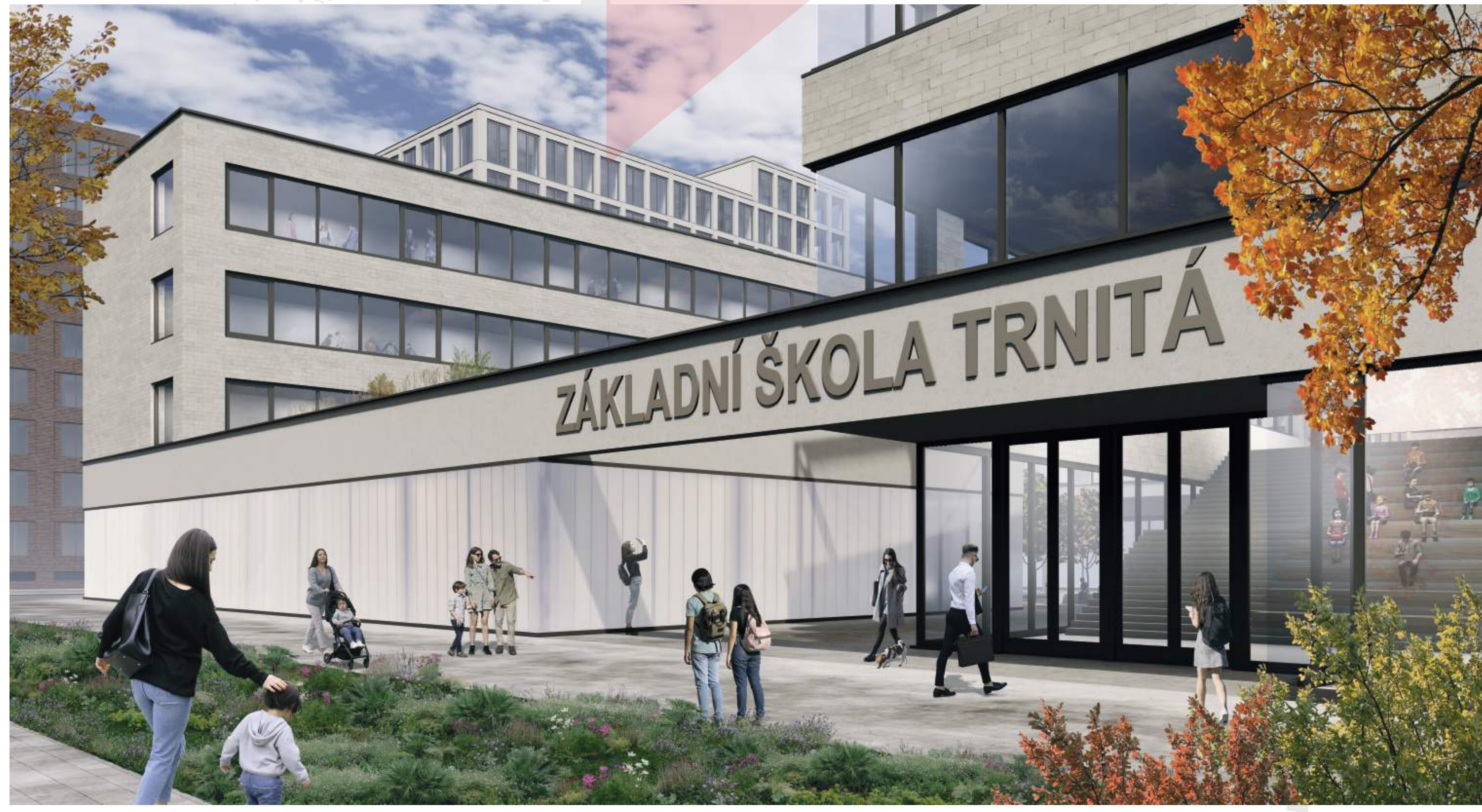
POHLED NA VSTUPNÍ PŘEDPROSTOR ZÁKLADNÍ ŠKOLY BRNĚNSKÉ KOMUNIKACE