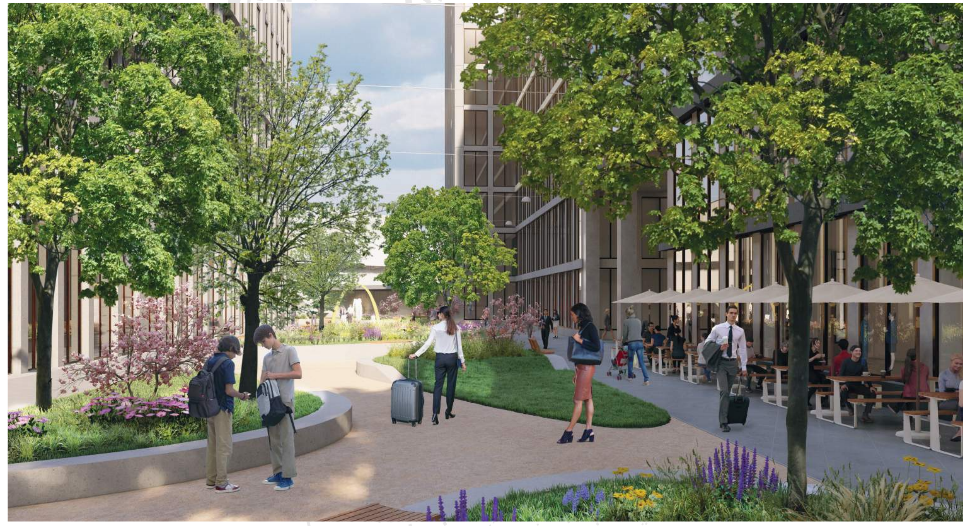
VEŘEJNÝ PROSTOR U ADMINISTATIVNÍ BUDOVY B S VODNÍM PRVKEM A PRVKY AKTIVNÍHO MĚSTSKÉHO PARTERU BRNĚNSKÉ KOMUNIKACE