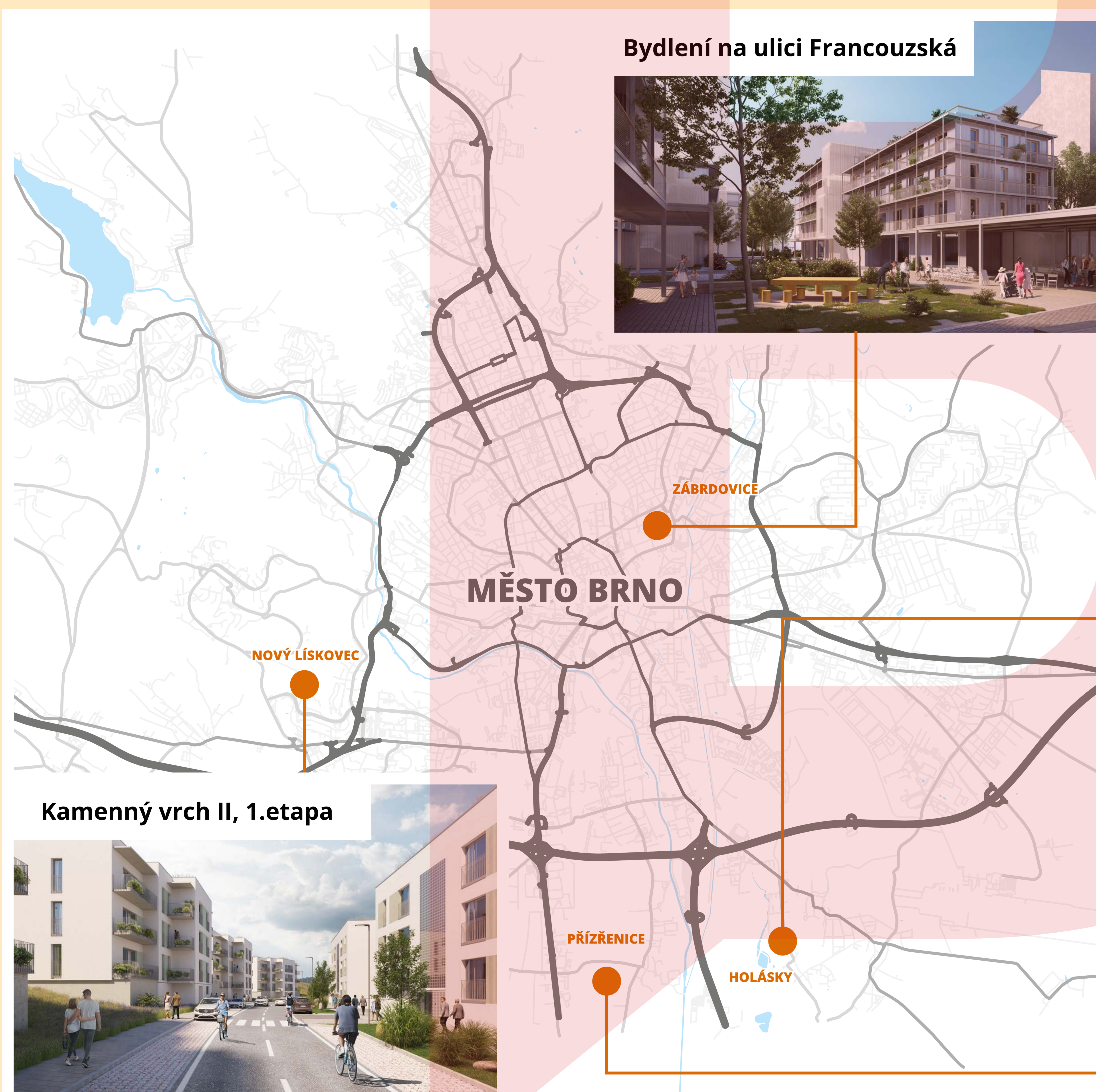
Bydlení na ulici Francouzská

Brno ve spolupráci se dvěma společnostmi ve vlastnictví města založí družstvo, přičemž jako svůj vklad vloží projektovou dokumentaci pro výstavbu a pozemek. Družstvo si následně sjedná úvěr u banky, vybere spolehlivého zhotovitele a zahájí výstavbu moderních bytových domů. Po kolaudaci budov budou do družstva vstupovat jednotliví členové – fyzické osoby, které vloží členský vklad podle požadavků banky. Nájemníci budou bydlet v družstevních bytech a platit nájemné družstvu, které z vybraných prostředků bude splácet úvěr. Doba splácení úvěru je plánována minimálně na 30 let, což umožňuje dlouhodobou a dostupnou cestu k vlastnímu bydlení.